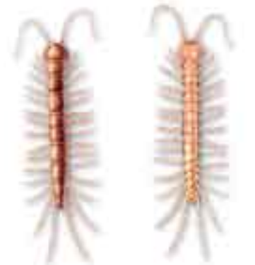
Mortolga externa de un quilópodo visto desde arriba y desde abajo.

QUILÓPODO, DA (Del gr. chilioi , mil, y poús , pie.) adj. Zool. Dicese de artrópodos de la familia de los miriápodos, de cuerpo aplanado, antenas largas, patas maxilares donde desembocan las glándulas venenosas, y un par de patas ambulatorias en cada anillo. Ú. t. c. s. || m. pl. Zool. Orden de estos animales.