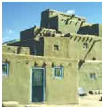
Ruinas de Gran Quivira en Nuevo México, EE. UU.

QUIVIRA Geog. hist. Ciudad imaginaria en América del Norte. Según el relato de fray Marcos de Niza, Quivira era una de las siete ciudades de Cibola, con calles que no alcanzaban a recorrerse en varios días, y con incalculables riquezas. Hoy se llama Gran Quivira, a las ruinas descubiertas al sur de Santa Fe, en el est. norteamericano de Nuevo México.