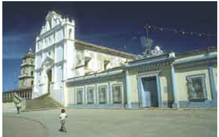
Edificio municipal de Quiché , Guatemala.

QUIJO m. Miner. Cuarzo usado generalmente como