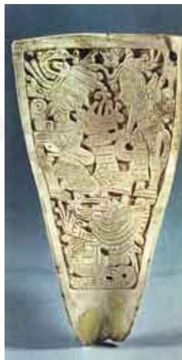
Broche de nácar grabado representando a Quetzalcóatl asistido por un sacerdote (arte huasteca).