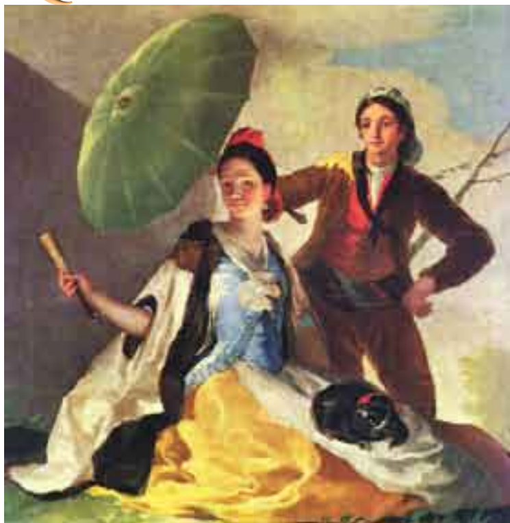
"El quitasol", obra de Goya.

mente en Vuelta Abajo . || Bot. En Cuba, planta herbácea, de la familia de las umbelíferas, de pequeñas flores blancas y variados usos medicinales.