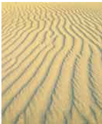
Desierto que cubre los yacimientos de petróleo, Qatar.

gosta y áspera entre montañas. || Amér. En Argentina, quiebro, esguince, contoneo.