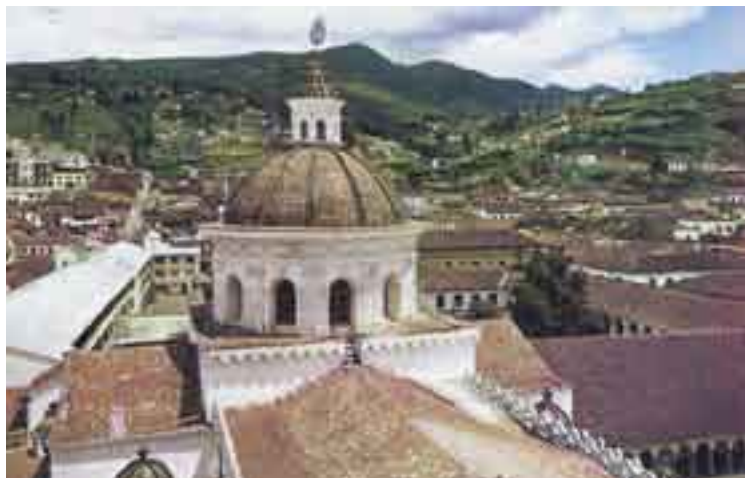
Cúpula de la Merced en Quito, Ecuador.

QUITINA (Del gr. chitón , túnica.) f. Hist. Nat. Capa de naturaleza córnea, la más superficial de las que conforman la estructura de la piel. Es impermeable. Además, endurece los élitros y otros órganos de los insectos.