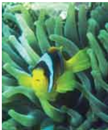
Fondos coralinos del golfo Pérsico en Qatar.