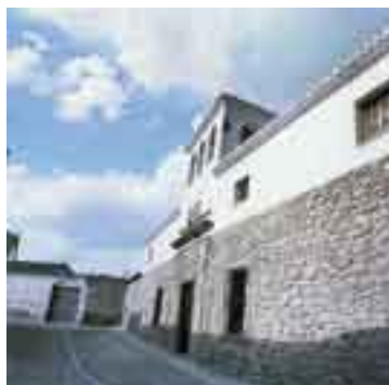
Don Quijote. Reconstrucción de la hipotética casa de Dulcinea del Toledo en Toledo, España.

QUIJOTE (Por alusión a don Quijote de la Mancha ) m. fig. Hombre excesivamente grave y serio. || Hombre exageradamente puntilloso. || Hombre que por intenso amor a lo ideal pugna con las opiniones y las corrientes modernas. || Hombre que pretende erigirse siempre en juez o defensor de asuntos que no lo conciernen. En este caso suele ir precedido del DON.