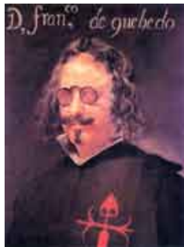
Retrato de Francisco Gómez de Quevedo y Villegas.

QUEVEDO Y VILLEGAS (FRANCISCO GÓMEZ DE) Biog. Famoso poeta, novelista, teólogo, historiador y político español, que mereció el sobrenombre de el JUVENAL ESPAÑOL . Destacóse en poesía ligera y satírica. Entre sus obras conocidísimas y consideradas como verdaderas obras de arte, citemos: Cartas del caballero