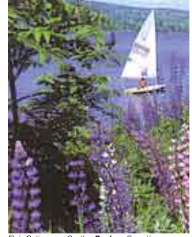
El río Gatineau en Cantley, Quebec, Canadá.

causa ni razón alguna. || ¿Y QUÉ? expr. con que se denota que lo dicho o hecho por otro no convence. QUEBEC Geog. Prov. de Canadá, limitada por las provincias de Ontario y New Brunswick, en la costa del Labrador, Estados Unidos, el estrecho y la bahía de Hudson y el golfo de San Lorenzo. Gran riqueza forestal y minera. Es la provincia más extensa del país, con 1.540.680 km²; pobl., 7.651.531 h. Cap. homónima. Ciudad más poblada: Montreal. Idioma: Francés. || Ciudad capital de esta provincia, a orillas del San Lorenzo. Pobl., 500.691 h. La aglomeración urbana tiene más de 700.000 h. Fundada por el explorador francés Samuel Champlain en 1608. Importante puerto fluvial.