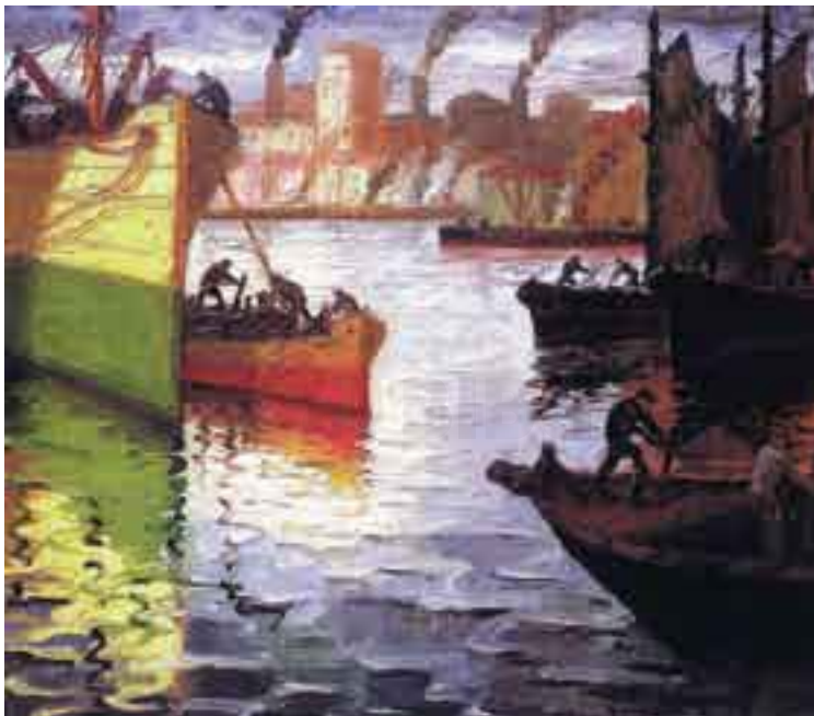
"Buque iluminado", obra de Benito Quinquela Martín .

QUINQUELA MARTÍN (BENITO) Biog. Pintor argentino que junto con Clemente Orozco y Diego Rivera, forma el triángulo de los grandes pintores sociales de América, su fecunda producción se encuentra repartida entre las mejores colecciones de Argentina, Brasil, Cuba, España, Estados Unidos, Francia, Gran Bretaña y Nueva Zelanda. Entre sus obras, mencionaremos: Crepúsculo en los astilleros de la Boca ; Draga en reparaciones ; Descarga de cereales , etc. (1890-1977).