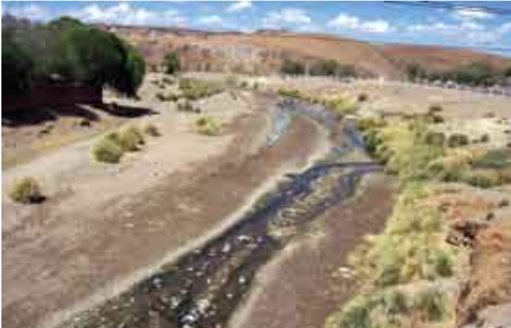
Río La Quiaca , Argentina.

de la Tenaza; El buscón ; Los sueños ; Satíficos en prosa ; La política de Dios ; Tratado de la Providencia divina, didácticas y morales , así como sus Discursos ascéticos y filosóficos ; el Chitón de las taravillas ; La rebelión de Barcelona , etc. Junto con Cervantes y Lope de Vega, don Francisco de Quevedo figura en la más alta cumbre del genio español. Nació en Madrid en 1580 y murió en Villanueva de los Infantes en 1645.