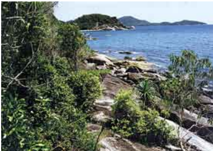
Exclusiva isla Bedarra en la barrera coralina australiana, Queensland.

QUEENS Geog. Uno de los cinco y el mayor de los distritos de la ciudad de Nueva York. Situado en el condado homónimo. Pobl., 2.293.007 h.