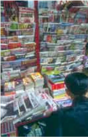
Quiosco de revistas en Hong Kong.

QUIOSCO (Del persa cuixc , pronunciado por los turcos, quioxo , quabellón ) m. Pabellón de estilo oriental, abierto por todos los frentes que se construye en jardines, azoteas, etc., para recreo y otros usos. || Edificio pequeño y generalmente circular u ochavado que se construye en plazas o paseos públicos, y en el que se expenden flores, cigarrillos, fósforos, diarios, revistas y otros artículos de bajo costo. || QUIOSCO DE NECESIDAD. Retrete público.