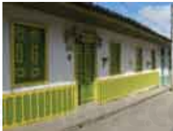
Typica fachada de Salento, Quindío, Colombia.

QUINDÍO Geog. Departamento del eje cafetero colombiano. Limita con los de Risaralda, Valle del Cauca y Tolima. Superficie, 1.845 km 2 ; población, 612.719 h. Su cap. es Armenia (360.000 h.). La agricultura es su principal actividad económica, plátano, yuca, frijol, soya, maíz y cítricos. Posee un rico potencial turístico como son las cavernas de Génova o Valle de Cocorá; el Parque Natural de los Nevados que comparte con Tolima, Caldas y Risaralda y los museos del Oro Quimbaya y el Parque del Café. || Picos nevados de la cordillera central de los Andes colombianos, en el departamento de Caldas y del Tolima. 5.150 metros de altitud.