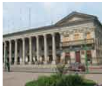
Edificio en el centro de Quetzaltenango.