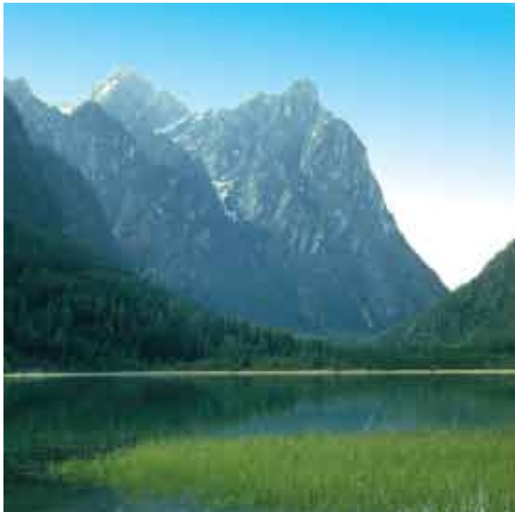
Islas Quinchao y Chilóe en el golfo del Corcovado, Chile.

QUINOLA f. Lance principal en cierto juego de naipes consistente en reunir cuatro cartas de un mismo palo, ganando cuando existen varios jugadores que tengan quínoia, aquella que suma más puntos, teniendo en cuenta el valor de las cartas. || fam. Extravagancia, rareza. || pl. Juego de naipes cuyo lance principal es la quínoia.