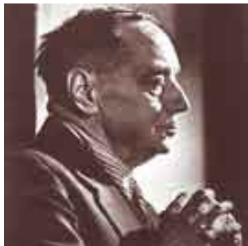
Heriberto Jorge Wells.

WELLS (CAROLINA) Biog. Escritora norteamericana, autora de novelas de aventuras y de misterio. Entre obras se citan: Siete edades de la infancia ; La marcha de Cain , etc. (1869-1942). || HERIBERTO JORGE—, fecundo escritor británico, autor de novelas fantásticas, del estilo de Julio Verne. También escribió sobre sociología, historia, etc. Sus obras más conocidas son: El salvamento de la civilización ; Cosas futuras ; La guerra de los mundos ; Un nuevo en el mundo , etc. Quizá su obra más destacada sea Esquema de la Historia Universal (1866-1946). || HORACIO—, Dentista norteamericano, nacido en 1815; descubrió las cualidades anestésicas del protóxido nitroso de Priestley. Murió en 1848.