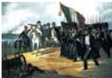
Escena de la batalla de Waterloo .

WEBERIO m. Unidad de flujo de inducción magnética en el sistema basado en el metro, el kg, el segundo y el amperio.