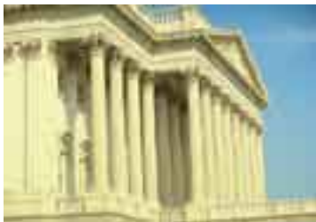
El Congreso, Washington , EE. UU.

WASMOSY (JUAN CARLOS) Biog. Ingeniero y político paraguayo (n. 1938). Elegido presidente de la nación por el Partido Colorado en los comicios de 1993, para el período 1993-1998. Durante su gobierno Paraguay pasó a formar parte del Mercosur y tuvo un importante crecimiento económico pero tuvo serias complicaciones financieras.