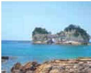
Paisaje de la Prefectura de Wakayama, Japón.