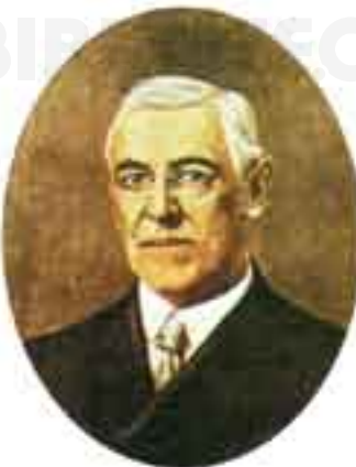
Tomás Woodrow Wilson.

WILSON Geog. Punta de la costa del estado de Quintana Roo, México, en la entrada de la bahía de la Ascensión. || MONTE —. Monte de Estados Unidos en el est. de California, tiene una altura de 1768 m. En él se encuentra instalado uno de los observatorios más grandes del mundo.