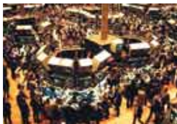
La Bolsa de Wall Street, EE. UU.

WALL STREET Calle de Nueva York, famosa por encontrarse en ella las oficinas de los más fuertes bancos de Estados Unidos. Su nombre suele usarse como sinónimo de los grandes intereses financieros norteamericanos.