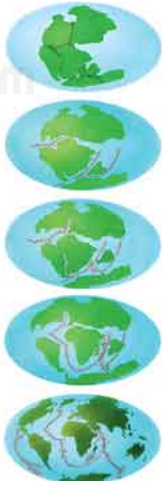
Esquema sobre la Teoría de Alfredo Lotario Wegener .

WEGENER (ALFREDO LOTARIO) Biog. Meteorólogo y