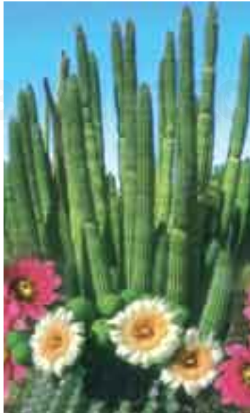
Cacto, planta xerófila .

XENOFOBIA (Del gr. xénos , extranjero, y phobos , espantarse.) f. Odio, aversión, repugnancia u hostilidad hacia extranjeros.