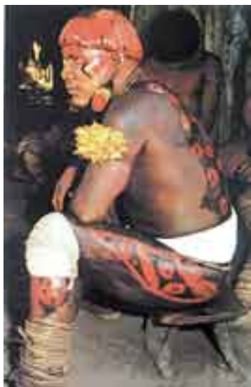
Luchador xingú en Brasil.

XILOGLIFIA (Del gr. xylon , madera, y glypho , tallar, esculpir.) f. Arte de grabar sobre la madera.