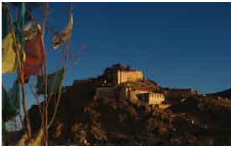
Templo en Xizang.

XUZHOU Geog. C. de China. Antes denom. SÚCHOW. Posee 2 millones de h. en el área urbana y más de 6 millones en el área metropolitana.