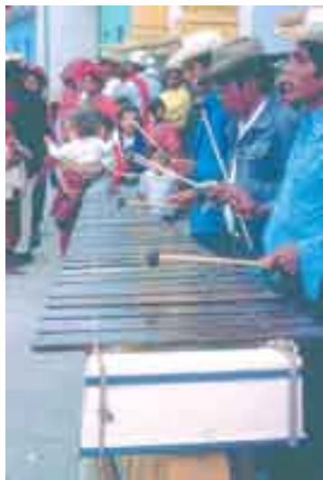
Xilófono usado en México.

XILÓFONO (Del gr. xylon , madera, y phoné , sonido.) m. Instrumento musical formado por una serie de láminas de madera, de distinta longitud, enfiladas por cordones o sostenidas por soportes de paja sobre los cuales se percute con dos martillos de madera. Es semejante a un xilórgano perfeccionado.