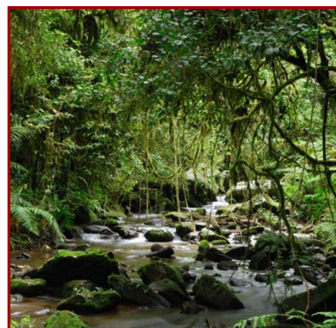
LOS PAISAJES NATURALES ESTÁN FORMADOS POR FACTORES BIÓTICOS Y ABIÓTICOS, SIN LA INTERVENCIÓN DEL HOMBRE.