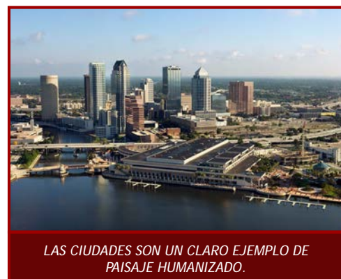
LAS CIUDADES SON UN CLARO EJEMPLO DE PAISAJE HUMANIZADO.