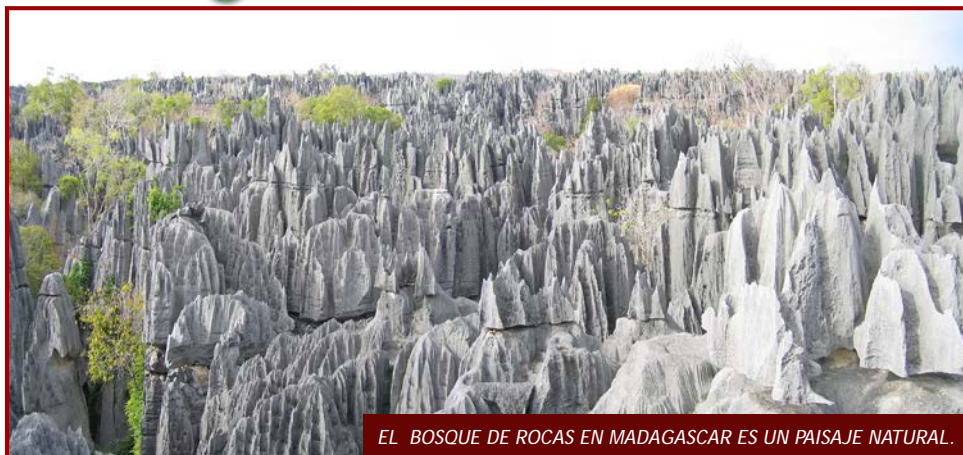
EL BOSQUE DE ROCAS EN MADAGASCAR ES UN PAISAJE NATURAL.