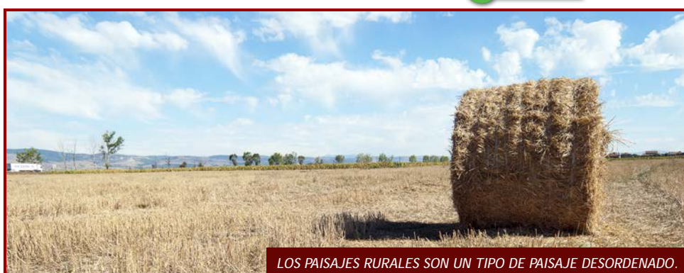
LOS PAISAJES RURALES SON UN TIPO DE PAISAJE DESORDENADO.