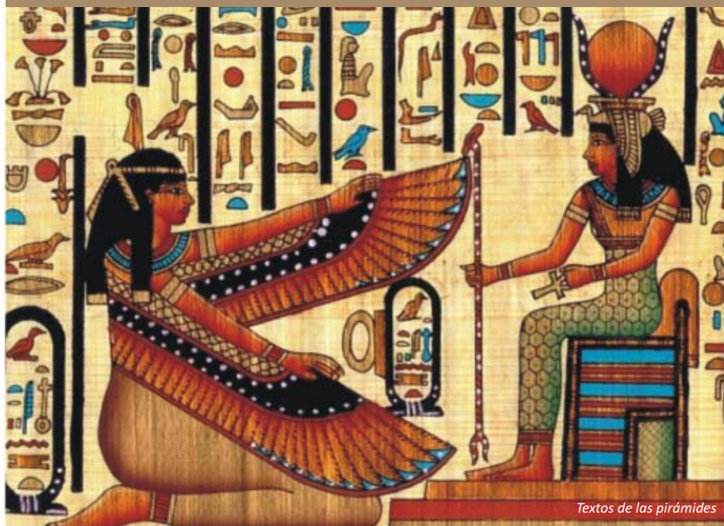
Textos de las pirámides

Los textos, son extractos de las teorías de la creación, de las luchas entre Horus y Seth, diferentes leyendas y sobre todo textos de ascensión, de resurrección o identificación con los dioses. Esto lógicamente puede significar que cuando fueron recopilados, las leyendas debían ser ya ampliamente conocidas, al menos en los círculos religiosos, por lo que es muy posible que estuviesen escritas, bien en otros monumentos menos duraderos, bien en papiros, mucho antes de ser grabadas en la pirámide de Unis.