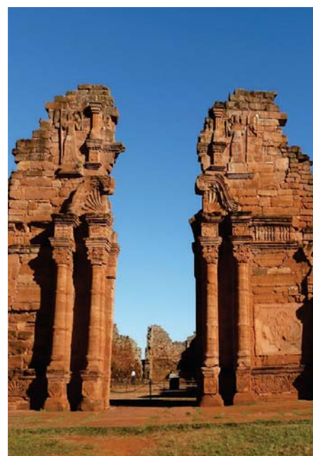
Portal de la iglesia de San Ignacio, ruinas jesuíticas en Misiones, Argentina .

ARGENTINA Geog. República federal del sur de Améri-