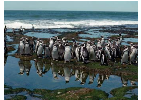
Punta Tombo (donde se encuentra la mayor colonia de pingüinos), Chubut, Argentina.