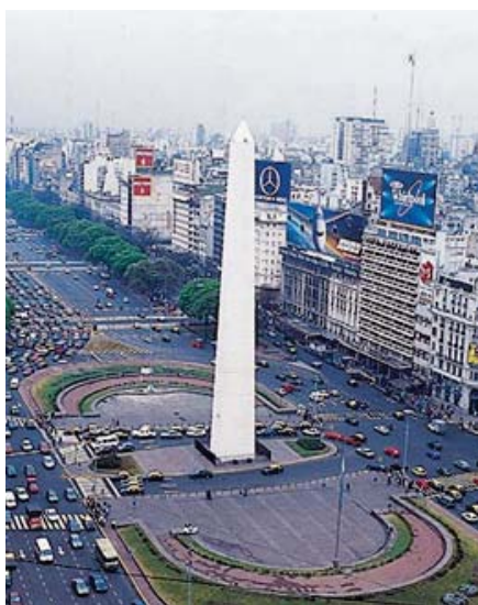
Vista de la ciudad de Buenos Aires, Argentina .

ARGELIA Geog. República democrática popular del norte de África. La capital es ARGEL. Limita al norte con el mar Mediterráneo; al este con Túnez y Libia; al sur con Níger, Malí y Mauritania y al oeste con Marruecos. Segundo país en superficie de África. La mayor parte de su extenso territorio corresponde al desierto sahariano (sector central y meridional) y el resto a las áreas montañosas del Atlas Sahariano (sector septentrional). Sólo es cultivable la vital región costera mediterránea, donde se localiza la mayor parte de la población y de las actividades económicas. Cereales, fosfatos, cítricos, dátiles, han integrado la lista de exportaciones tradicionales. Es un estado en desarrollo, de economía predominantemente petrolera. Produce también gas natural. La pertenencia a la gran región del Maghreb ha determinado, durante largo tiempo, la historia de Argelia y sus estados colindantes: Túnez y Marruecos. Idiomas: árabe clásico y