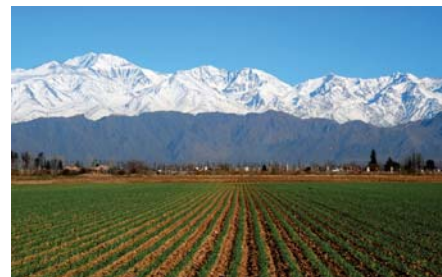
Región de Cuyo, importante zona agroindustrial de Argentina .

ca del Sur. Limita al norte con Bolivia, Paraguay y Brasil; al este con Brasil, Uruguay y el océano Atlántico; al sur con el Polo Sur geográfico y al oeste con Chile y el océano Pacífico con una posición geográfica periférica. Su territorio está dividido en 23 provincias y una ciudad autónoma, Buenos Aires, capital de la nación y sede del gobierno federal. Supera los 40 millones de habitantes. Es un estado intermedio en lo concerniente al proceso de desarrollo, así como también al de ocupación y organización territorial. Su singularidad está dada por la dotación y variedad de sus riquezas naturales y la calificación de su población. Argentina es el segundo país más grande de América del Sur, después de Brasil y uno de los más grandes del mundo ubicado en octavo lugar después de Rusia, Canadá, China, Estados Unidos, Brasil, Australia e India. La distancia geográfica que la separa de todos los centros de poder actuales es inmensa. Esto la coloca fuera de los grandes flujos de circulación mundiales. El aislamiento argentino muchas veces percibido como un rasgo negativo puede, sin embargo, ser lo contrario. Ese estar lejos le permite mantenerse a una distancia prudencial de las zonas calientes y