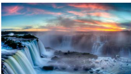
Cataratas del Iguazú, Misiones, Argentina .

en 1803. Inventor de la lámpara de corriente doble de aire, en 1784, que el farmacéutico Quinquet se apropió introduciéndole una pequeña modificación y dándole su nombre. Argand hizo estudios para el mejoramiento de los vinos y se le atribuye una máquina neumática de válvulas cónicas. Como matemático está entre los primeros que expusieron la teoría de las cantidades imaginarias. El despojo de que fue víctima por parte de Quinquet contribuyó a que perdiera la razón.