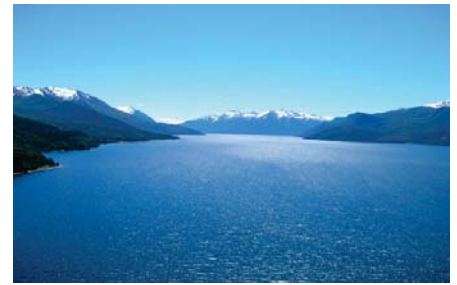
Vista del lago Nahuel Huapi, Río Negro, Argentina.