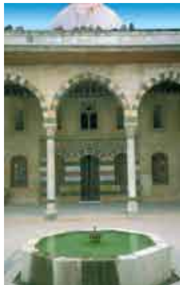
Fuente del patio del palacio Azn en Hama, Siria.

HAMA Geog. Distrito de Siria, a orillas del Orontes, en la Gobernación homónima. Ext., 8.844 km 2 ; pobl., 1.491.000 hab. Cap. homónima, cerca de 400.000 hab.