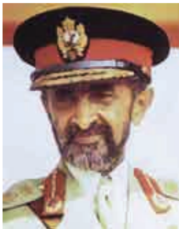
Haile Selassie I.

HAILE SELASIE I Biog. Emperador de Abisinia o Etiopía. Hijo del ras Makonnen (primo hermano del emperador Menelik II), el ras Tafari Makonnen (que así se llamaba Haile Selasie antes de ocupar el trono) (1891-1975). Cuando el emperador Lij Yasu (nieto y sucesor de Menelik II) fue depuesto en 1916, su tía Zaoditu o Zeodita (hija de Menelik) vino a ser emperatriz, y el ras Tafari fue proclamado heredero del trono. Desde entonces Tafari actuó como regente; en 1928 fue coronado rey ( Negus ); y en 1930, a la muerte de Zaoditu, fue proclamado emperador ( Negus Nagast , rey de reyes) y coronado como tal con el nombre de Haile Selasie I. En 1935-1936, el territorio abisinio fue invadido y ocupado por Italia, y Haile Selasie se vio obligado a exiliarse, aunque sin renunciar a sus derechos. En 1941 los ingleses expulsaron del país a los italianos y repusieron en el trono a Haile Selasie I.