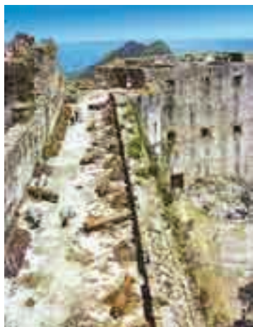
La ciudadela de Cap-Haïtien, Haiti .

Israel en Egipto , etc. Fue émulo de Bach. N. en 1685, y m. ciego en 1759 en Londres, donde residió gran parte de su vida.