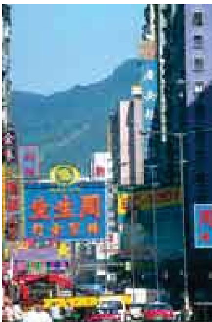
Calle comercial de Nathan en Koeloon, Hong Kong, China.

HONGO (Del lat. fungus .) m. Bot. Cualquiera de las plantas acotiledóneas o celulares de colores diversos, jamás verde, consistencia corchada, carnosa, esponjosa y gelatinosa, y generalmente en figura de sombrero o casquete, sostenido por un pequeño pie; como el cornezuelo, el carboncillo, la seta, el moho, la roya, etc. || Sombrero de castor o fieltro y de copa ovalada o chata. || Pat. Excrecencia fungosa que crece en las úlceras o heridas, impidiendo la cicatrización.