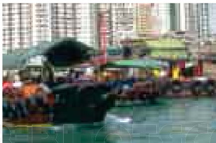
Amarradero de embarcaciones particulares en Hong Kong, China.

HONG KONG Geog. Isla de la costa meridional de China, sit. al este de la bahía de Cantón. Tiene una extensión de 79,81 km 2 , perteneció al Reino Unido de Gran Bretaña desde 1841 en que fue cedida por China en 1861 hasta 1997. || Antigua colonia británica de 1.074 km 2 formada por la isla homónima, la península de Kowloon (42 km 2 ) y desde 1898 otra porción continental denominada Nuevo Territorio (95 km 2 ). || Región Administrativa especial de China, nacida de la Declaración Conjunta sino-británica de 1984, por la cual el Reino Unido acordó retornar la colonia a China continental el 1 de julio de 1997, y Beijing se comprometió a darle dicho status autónomo y no cambiar su economía capitalista y estilo de vida durante 50 años, bajo el lema "un país, dos sistemas".