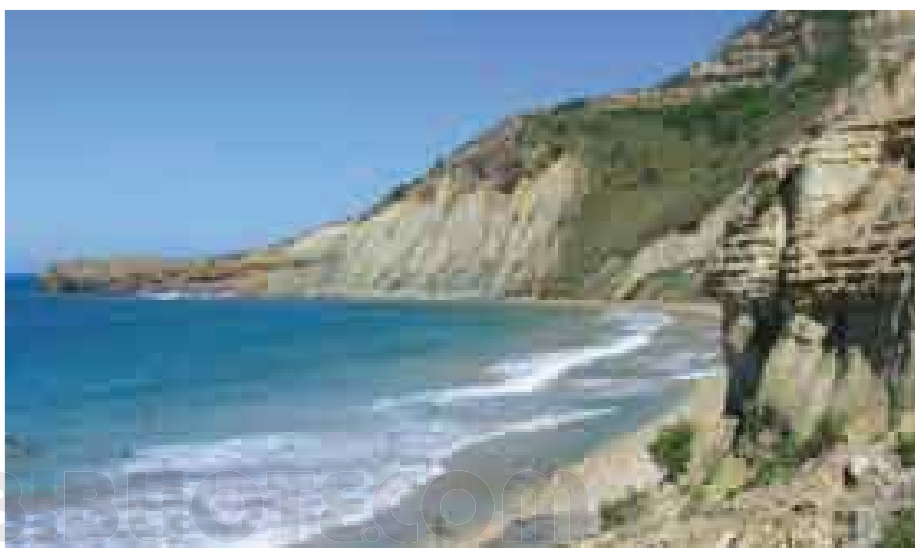
Vista de la playa El Morro, República Dominicana.

habitantes. Comprende Bohemia, Moravia y Silesia. Bohemia es una meseta rodeada por las montañas conocidas como el "Cuadrilátero de Bohemia". La red fluvial desemboca en el Danubio. Agricultura. Minería. Industria diversificada, destacándose la de instrumentos musicales. Turismo. Moravia, la parte oriental, es también montañosa y está drenada por el río Morava. Silesia, la parte en el norte de Moravia, está entre Moravia y Polonia. En 1992, según un pacto mutuo, los jefes de gobierno de la República Checa y de Eslovaquia decidieron dividir Checoslovaquia surgiendo el 1º de enero de 1993 la República Checa. Vaclav Klaus es el actual presidente.