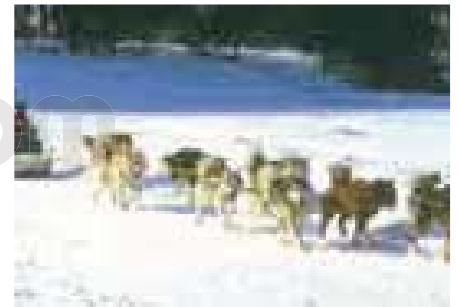
Trineo tirado por perros.

TRINCHO m. Col . Parapeto, dique, defensa.