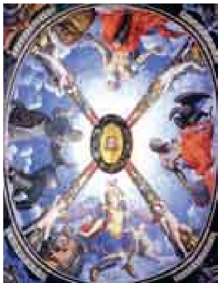
"La Trinidad con San Miguel, San Antonio, San Francisco, San Jerónimo y San Juan Bautista",

TRINQUETE (De triquete .) m. Mar. Verga mayor cruza-