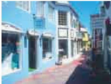
Calle de Roxborough en Tobago, Trinidad y Tobago .

TRILLIZO adj. Barbarismo por gemelo o mellizo. || Dícese de cualquiera de los tres hermanos nacidos de un mismo parto. Ú. t. c. s.