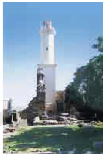
Faro en Colonia del Sacramento, Uruguay.