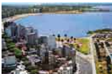
Vista de Punta del Este, Uruguay.