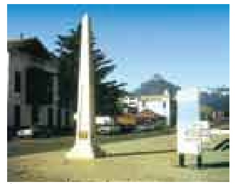
Obelisco de señalamiento en Ushuaia, Tierra del Fuego, Argentina.