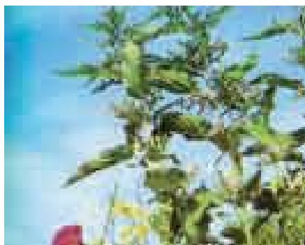
Ortiga, planta urticácea.

URTICÁCEO, A (Del lat. urtica , ortiga.) adj. Bot. Dícese de plantas dicotiledóneas, hierbas o arbustos, de hojas sencillas, opuestas o alternas, con estípulas y provistas por lo común de pelos que secretan un jugo urente; florecillas en espiga, panoja o cabezuela; fruto desnudo o envuelto por el perigonio y semilla de albumen carnoso; como la ortiga y la paretaria. Ú. t. c. s. || f. pl. Bot. Familia de estas plantas.