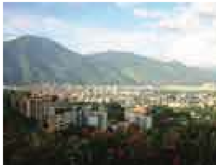
Vista parcial de la ciudad de Caracas, Venezuela .