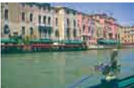
Vista del Gran Canal de Venecia, Italia .

VENER Geog. Lago de Suecia, el mayor de la península escandinava, y el tercero de Europa. Comunica con el Vetter y vierte sus aguas en el Cattegat por el Götaelf. Sup., 6238 km 2 .