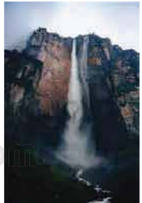
Salto Ángel, Venezuela .

VENDIMIARIO (Del fr. vendémiaire .) m. Primer mes del almanaque republicano francés, cuyos días primero y último coinciden respectivamente, con el 22 de septiembre y el 21 de octubre.