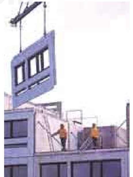
Instalación del ventanaje de un edificio.

VENTANAJE m. Conjunto de ventanas pertenecientes a un edificio.