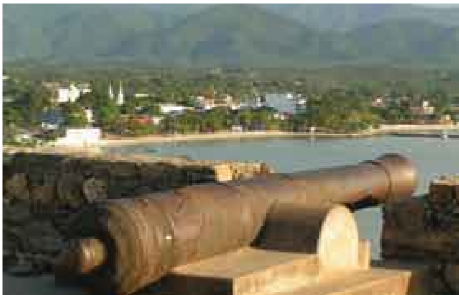
Vista de la Isla de Margarita, Venezuela.