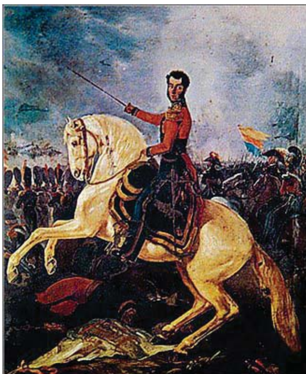
Bolívar y su misión en el norte

En Guayaquil Bolívar recibe a San Martín para conferenciar sobre la continuación de la campaña en el Perú. Allí recibe la invitación del gobierno peruano para luchar contra las fuerzas realistas que estaban concentradas en el Perú.