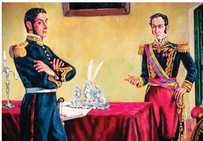
San Martín y Bolívar reunidos

A los tres días estaba en Lima un batallón patriota a las órdenes del General Necochea. La municipalidad, en cabildo abierto, expresó su simpatía a San Martín y le invitó a que fuera a Lima.