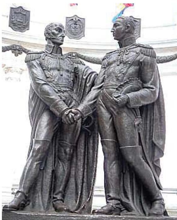
Monumento al encuentro entre Bolívar y San Martín

A pesar de todo esto, actuando Don Hipólito Unanue como Ministro de Hacienda, se estableció una suscripción voluntaria entre los patriotas, recolectándose una considerable suma.