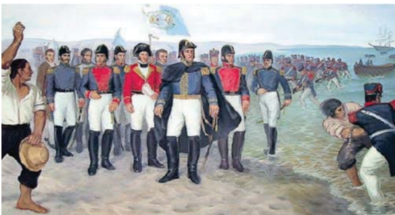
Virrey Francisco de Toledo

El 27 de Diciembre, se levantó en armas Lambayeque, destituyendo a las autoridades españolas, y proclamando su independencia.