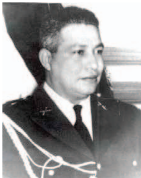
Teniente Coronel Oscar Osorio.