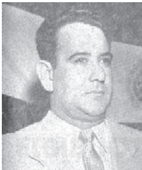
Teniente Coronel José María Lemus.