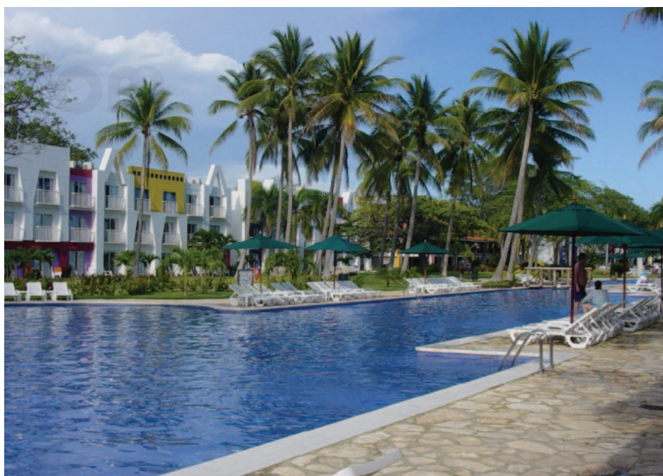
Sonsonate, El Salvador.