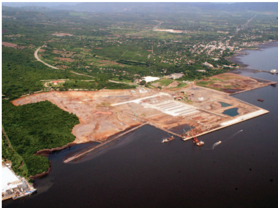
Puerto La Unión.

Se desempeñó como Ministro del Interior de 1949 a 1955. Dos años más tarde fue elegido presidente de la República, cargo que conservó hasta 1960. Su gobierno se vio imposibilitado de continuar con las política de moderada reforma social del anterior presidente Óscar Osorio dado que el panorama económico había cambiado. Se registró una fuerte caída del valor del café lo que conllevó a protestas y movimientos populares.