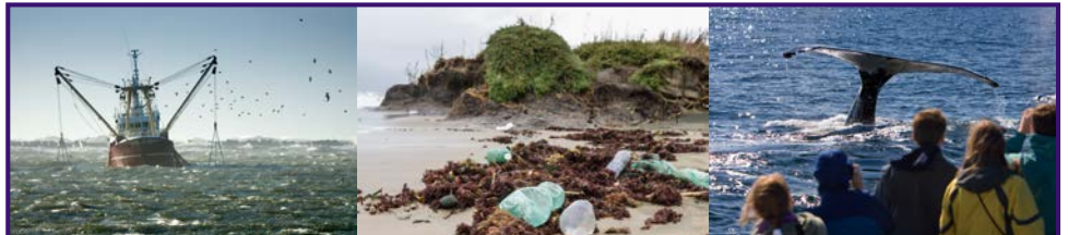
La pesca indiscriminada, la contaminación, y las actividades humanas afectan la vida marina y causan el desequilibrio del ecosistema.