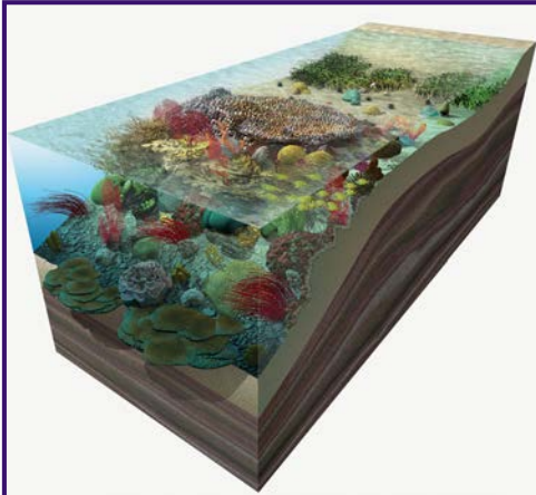
El fondo y el agua son elementos abióticos muy importantes.

Los componentes bióticos se relacionan con los abióticos para mantenerse y desarrollarse en el ecosistema. Si uno de estos factores cambia también cambiará toda la comunidad. Por ejemplo, las alteraciones constantes en el clima afectan considerablemente la supervivencia de miles de especies en todo el mundo.