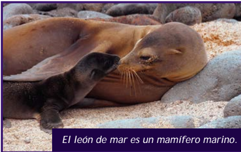
El león de mar es un mamífero marino.

En estos ecosistemas podemos encontrar toda clase de seres vivos. Muchas especies de mamíferos marinos (como orcas, lobos marinos, delfines), abundantes peces (como tiburones y salmones), reptiles (como tortugas) y organismos muy pequeños (como el plancton o las algas y corales). La mayor parte de la vegetación se encuentra en las costas y está adaptada a la salinidad del agua.