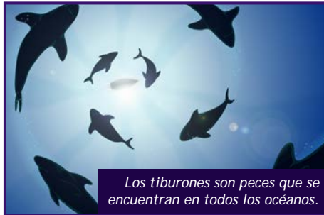
Los tiburones son peces que se encuentran en todos los océanos.