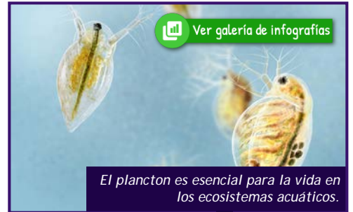
El plancton es esencial para la vida en los ecosistemas acuáticos.