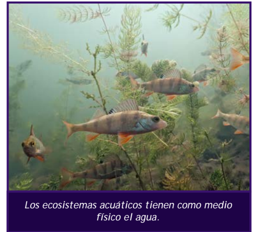
Los ecosistemas acuáticos tienen como medio físico el agua.