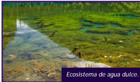
Ecosistema de agua dulce.