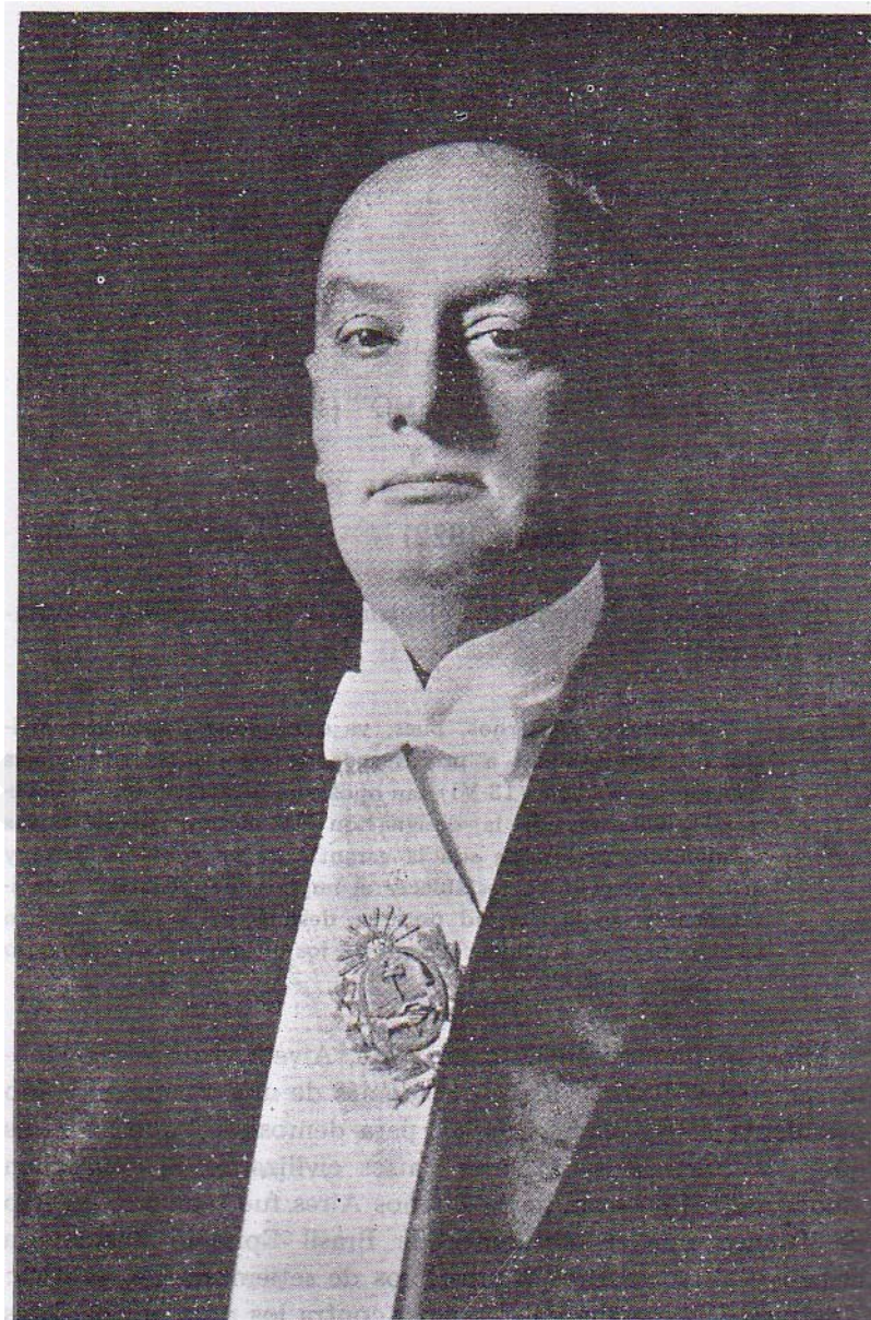
MARCELO T. DE ALVEAR (1868-1942) Presidente 1922-1928