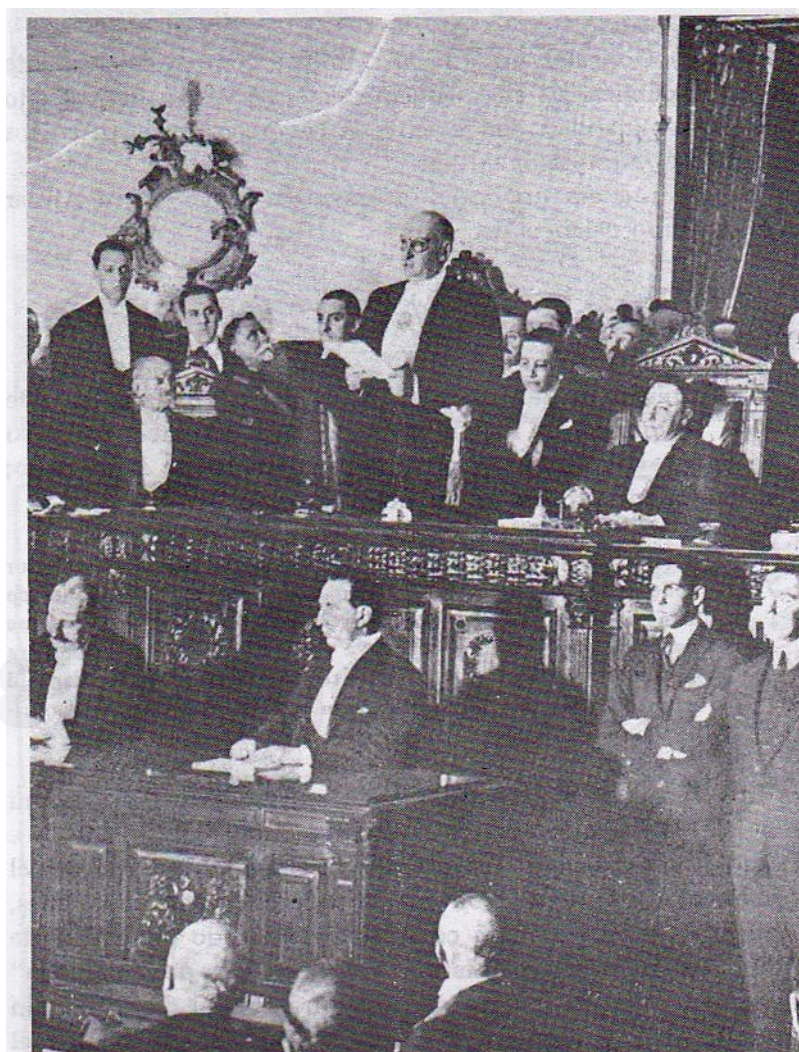
Alvear leyendo su mensaje de apertura del congreso en mayo de 1923.