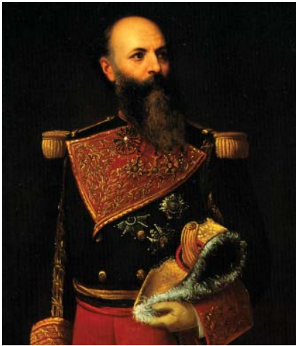
ANTONIO GUZMÁN BLANCO.