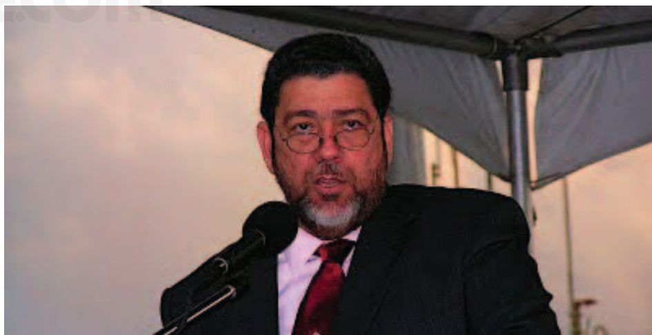
En un evento.

Nació en 1944. Estudió la carrera de economía y luego realizó una Maestría. Se dedicó a trabajar en el ámbito político. Fue miembro del Nuevo Partido Democrático el cual fue fundado y dirigido por el ex Primer Ministro James Fitz-Allen Mitchell. En las Elecciones Generales celebradas el 27 de octubre de 2000 fue elegido Primer Ministro. Estuvo en el poder durante cinco meses. Luego se convirtió en Líder de la oposición de la Cámara de la Asamblea de San Vicente y las Granadinas.