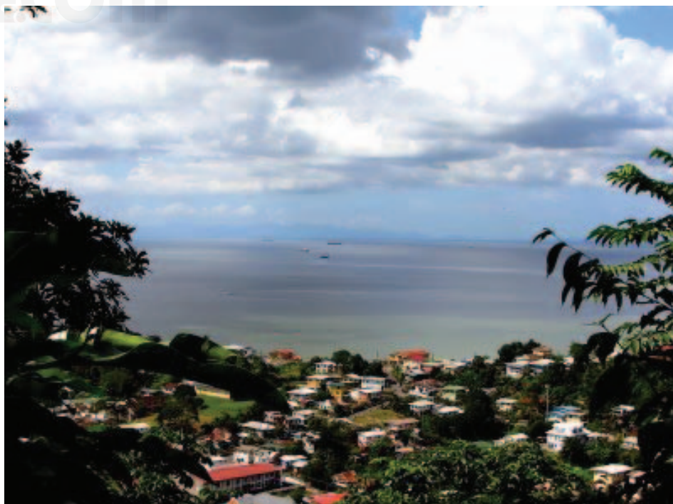
San Fernando, Trinidad y Tobago.

Nació el 17 de agosto de 1946 en San Fernando, Trinidad y Tobago. Realizó sus estudios de grado en la Universidad de West Indies. Antes de comenzar su carrera política trabajó para la empresa Texaco Trinidad Ltd. como geologista.