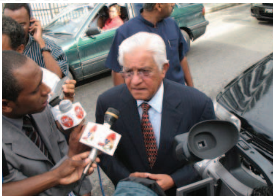
Durante una entrevista.

Antes de comenzar su carrera como profesional trabajó como pesador de caña, maestro de escuela primaria y funcionario. Más tarde se especializó en leyes en la Inn Lincoln, Universidad de Londres y en Escuela de Londres de Arte Dramático.