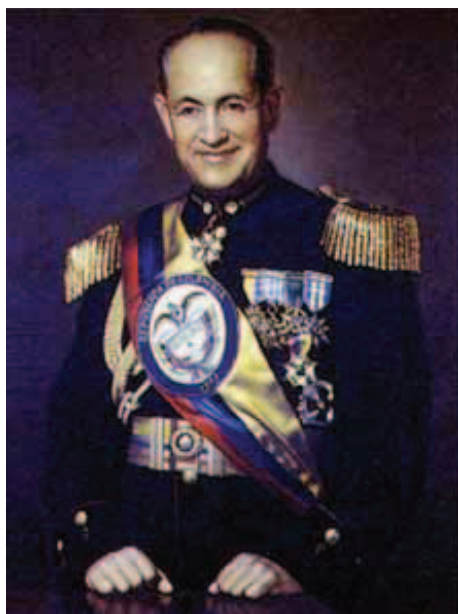
Gustavo Rojas Pinilla.