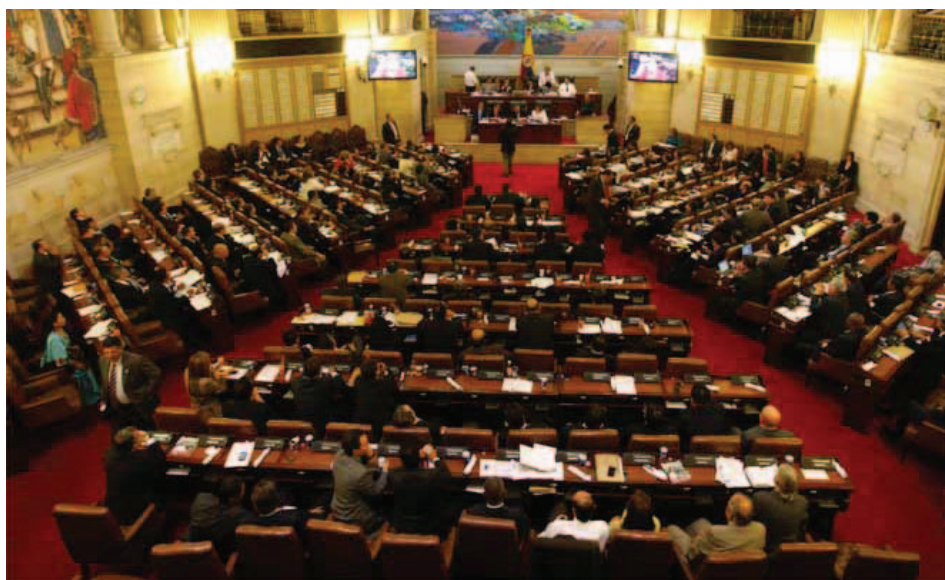
Cámara de Representantes.

Vinculado al Partido Liberal, llegó a ser Secretario General del mismo, y en 1930 inició su labor parlamentaria.