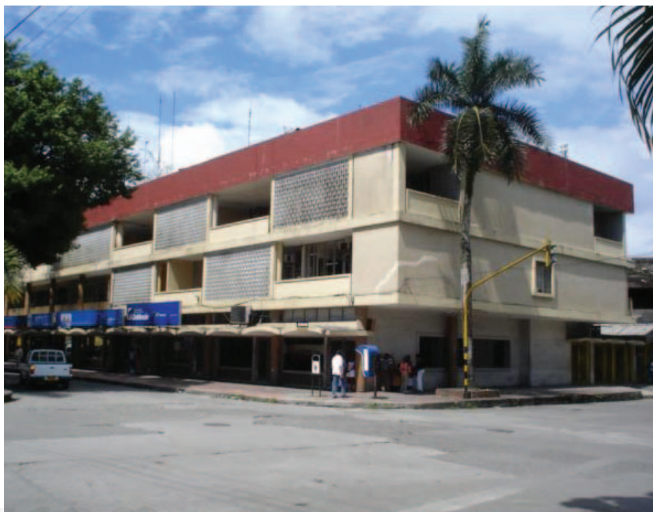
Antiguas oficinas de la Flota Mercante Grancolombiana.

Sus principales políticas apuntaron a recuperar por parte del Estado el control sobre los espacios públicos y la instauración del orden, y a sobrellevar la situación financiera desfavorable por la cual pasaba el país.