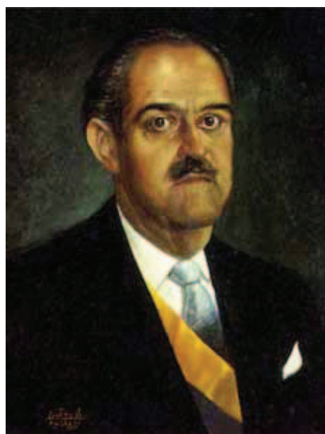
Guillermo León Valencia.

Su gestión finaliza en 1962, sin poder cumplir con los objetivos de pacificar el país o mejorar la calidad de vida de los colombianos. Luego de dejar su cargo, Camargo volvió a volcarse a las tareas periodísticas y continuó ligado al Partido Liberal tomando el cargo de presidente del mismo. Falleció el 4 de enero de 1990 en la ciudad de Bogotá.