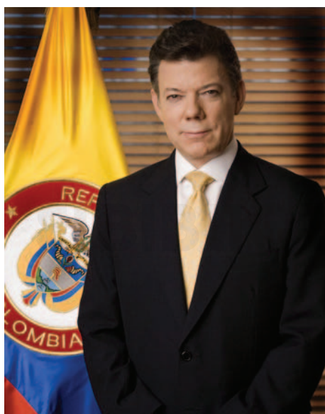
Juan Manuel Santos.

Intentó habilitar la posibilidad de acceder a una tercera gestión, aunque la justicia no se lo permitió, por lo que al finalizar su mandato se encargó de organizar "talleres democráticos" y a participar en una comisión especial de la ONU para investigar un ataque de la aviación de Israel a una flota humanitaria turca.