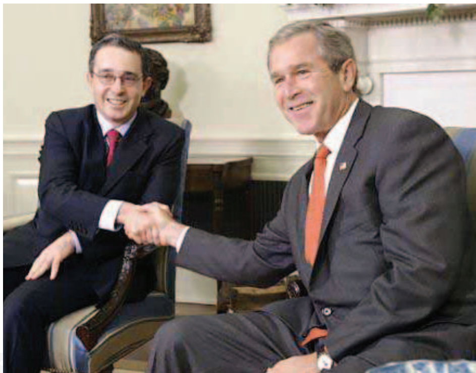
Junto a George W. Bush..

En 1998 comenzó a desempeñarse como profesor asociado de la Universidad de Oxford, y en 2001 participó en el armado de la campaña electoral del liberal Horacio Serpa Uribe, aunque éste terminaría por desprenderse del Partido Liberal por diferencias en las políticas en torno a la guerrilla.