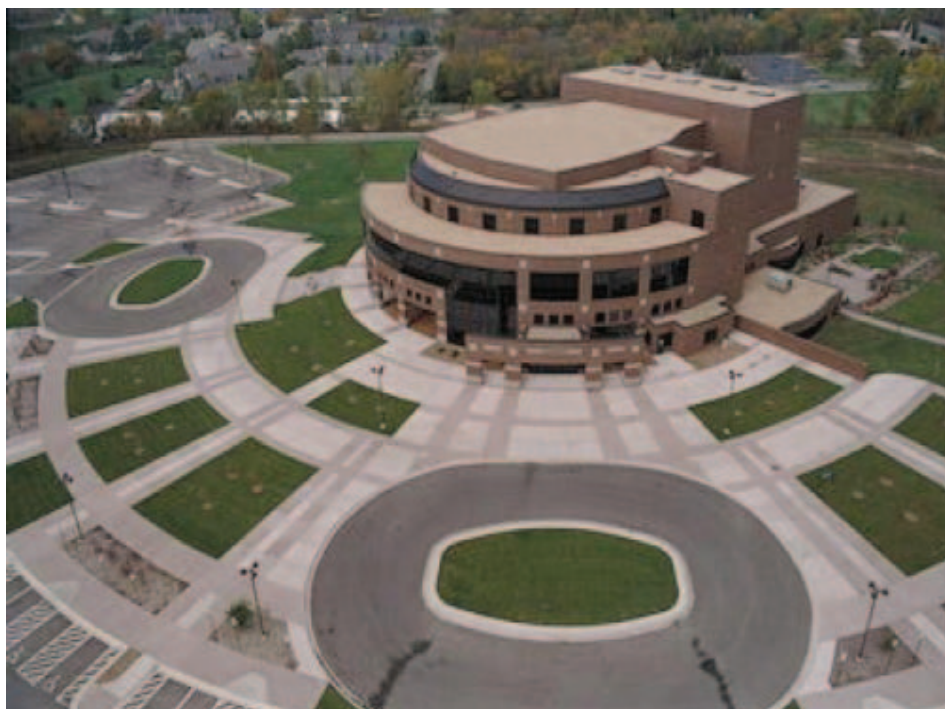
Universidad de Kansas.

Juan Manuel Santos nació en 1951 en la ciudad de Bogotá, en una familia vinculada históricamente con la política. Su familia privilegiaba la educación por sobre otras actividades, por lo que Manuel Santos fue motivado durante toda su infancia para sacar buenas notas en el bachiller e ingresar en una buena universidad.