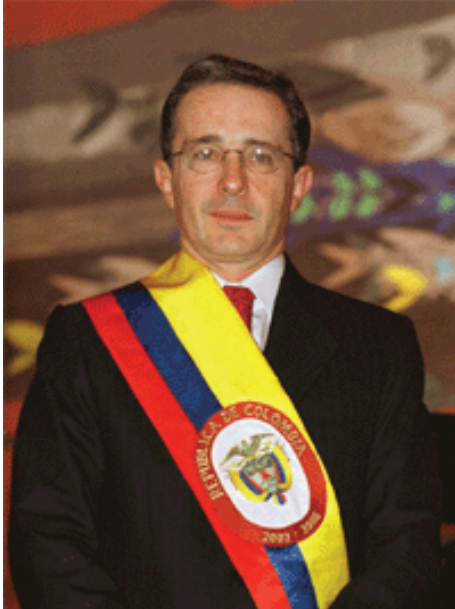
Álvaro Uribe Vélez.

También se dedicó a escribir diversos libros y a publicar numerosos artículos, muchos de ellos críticos con las políticas de Álvaro Uribe, especialmente aquellas relacionadas con el trato con los paramilitares, el narcotráfico y la participación del presidente venezolano Hugo Chávez en el acuerdo humanitario colombiano.