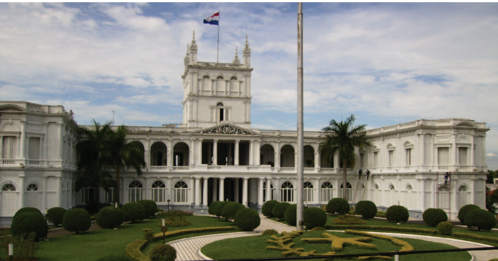
Palacio de los López, residencia presidencial.

Con una superficie total de 406.750 kilómetros cuadrados, Paraguay es un país de América Latina que limita al sur, sudeste y sudoeste con la República Argentina; al este con Brasil y al noroeste con Bolivia. No tiene salida al mar, pero cuenta con una gran riqueza hidrográfica. De hecho, su nombre deriva del término guaraní "paraguay", que se traduce como "de un gran río", en referencia al río Paraná. Éste es el caudal hidrográfico que mayor cantidad de energía produce en todo el mundo. Además, gracias a este importante recurso el país cuenta con una gran fuerza hidroeléctrica y condiciones muy favorables para la explotación agrícola.