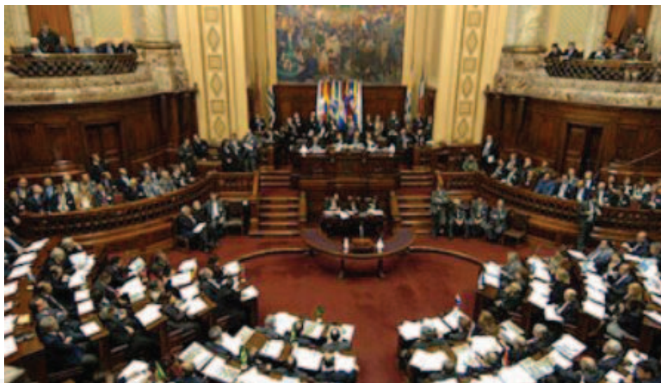
Congreso de Paraguay.

El Poder Ejecutivo del Paraguay es ejercido por su Presidente, que es Jefe de Estado y Jefe de Gobierno. Está secundado por el Vicepresidente, quien lo sustituye en todas sus derechos y obligaciones en caso de ausencia temporal o impedimento. Tanto uno como otro son elegidos democráticamente en votación popular conjunta; sus cargos duran cinco años y no tienen posibilidad de ser reelectos. El Ejecutivo se completa con la figura de los ministros; éstos son nombrados directamente por el Presidente. Por otra parte, cada departamento es dirigido por un gobernador y una junta departamental que se eligen por votación popular para una gestión de cinco años. Los municipios son dirigidos por un intendente y una junta municipal.