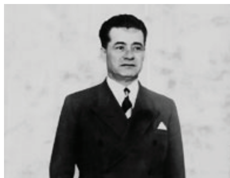
José Félix Estigarribia.