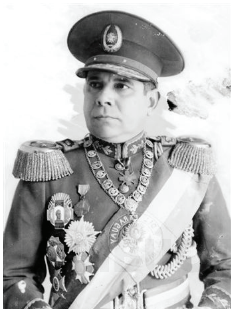
Higinio Morínigo Martínez.

En 1936 un golpe militar derrocó al presidente Eusebio Ayala, por lo que Estigarribia fue apresado y luego se exilió a la ciudad de Montevideo, Uruguay. Regresó al Paraguay en 1938; luego viajó a Washington, Estados Unidos, donde fue enviado por el gobierno para hacerse cargo de negociar la paz definitiva con Bolivia. En 1939 ocupó la presidencia de la República como héroe nacional. Entre los hechos más destacados de su mandato se menciona la promulgación de la Constitución de 1940, que reforzó el papel del poder Ejecutivo. Luego de su muerte, ocurrida como consecuencia de un accidente de aviación, donde murió junto a su esposa y el piloto, se le otorgó el ascenso póstumo a Mariscal.