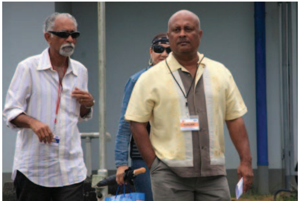
En un evento.

Nació en Paramaribo, capital de Surinam. Es militar y político reconocido por haber dado el golpe de estado que dejó al presidente Ramsewak Shankar fuera de su cargo.