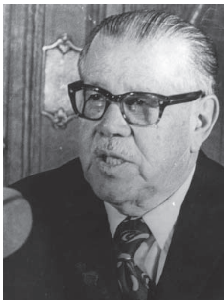
Aparicio Méndez Manfredini.