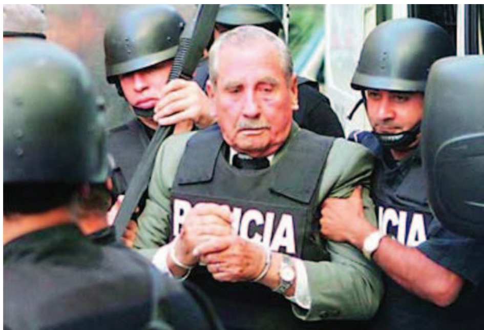
Protegido por la policía.

estudio, asesoramiento, coordinación y planificación de las acciones anti guerrilleras. Desde este cargo, dirigió la represión contra los Tupamaros.