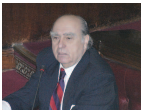
José María Sanguinetti.

Durante el gobierno de facto que se impuso en 1973, fue secretario permanente del Consejo de Seguridad Nacional. En 1981 fue designado al frente de la presidencia del Uruguay. Desde allí continuó con la represión a las guerrillas y negoció el Cronograma Electoral que convocó a elecciones legislativas y presidenciales para noviembre de 1984. Una vez celebrados los comicios y electo el nuevo presidente democrático, dimitió de su cargo.