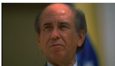
Carlos Andrés Pérez.

Implementó los programas "Conquista del Sur" y de Promoción Popular, éste último con la intención de facilitar la organización de las masas populares para incentivar la participación directa de los ciudadanos en las actividades cívicas. Llevó adelante un gobierno de Nacionalismo Democrático, abriendo espacios de diálogo y sosteniendo medidas de cuidado y aprovechamiento de los recursos naturales. En 1988 se distanció de su partido y pasó a encabezar una nueva plataforma política, denominada Convergencia. Con ésta agrupación logró ser electo para un segundo mandato presidencial por el periodo 1994-1999. En este segundo mandato debió afrontar una profunda crisis financiera y bancaria, en un conflictivo contexto de suspensión parcial de las garantías constitucionales.