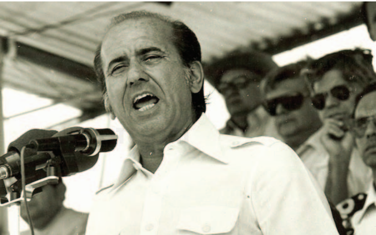
Durante un discurso.

la carrera de Derecho en la Universidad Central de Venezuela. En 1938 se afilió al Partido Democrático Nacional (PDN). En 1945 fue secretario de Rómulo Betancourt y del Consejo de Ministros de la Junta de Gobierno. Fue diputado electo al Congreso Nacional en 1948. Tras el derrocamiento de Rómulo Gallegos pasó un año en prisión; una vez liberado se exilió en Curazao y luego viajó hacia Bogotá. Más tarde se trasladó a Costa Rica, donde continuó sus estudios sin llegar a graduarse. Intentó regresar clandestinamente a su país, por lo que fue arrestado y expulsado. Viajó a La Habana, Cuba, y luego a Costa Rica. Logró regresar a Venezuela en 1958. Se ocupó de reorganizar el partido Acción Democrática (AD) y fue electo diputado al Congreso.