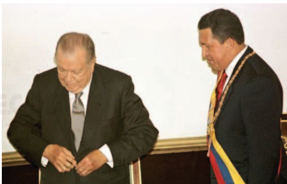
Junto a Hugo Chávez.

Creó el Instituto de Altos Estudios de la Defensa Nacional, la Escuela Superior de las Fuerzas Armadas de Cooperación y el Instituto Tecnológico Universitario de las Fuerzas Armadas. Implementó políticas de protección del recurso petrolero. Realizó importantes reformas en el sistema educativo, modificando los programas de estudio en todos los niveles. Logró crear numerosas fuentes de trabajo y consiguió la firma de más de seis mil quinientos contratos colectivos. En el área laboral, también concretó importantes mejoras con la sindicalización de los empleados públicos y la sanción de la Ley de Carrera Administrativa. Invertió importantes esfuerzos en la construcción de obras de vialidad, puertos y aeropuertos, con lo cual se produjo un gran desarrollo urbano con políticas de cuidado ambiental.