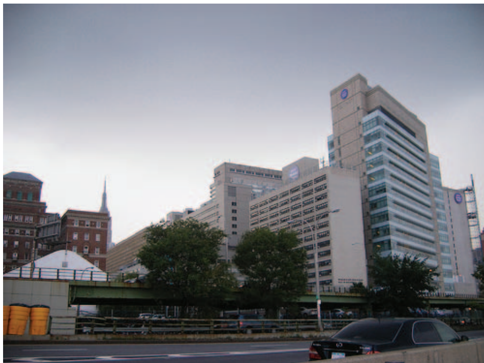
Belevue Medical Center.

Nació el 27 de mayo de 1924 en Clarines, Anazótegui. Cursó la escuela primaria en su ciudad natal, continuó sus estudios secundarios en el Colegio Federal de Barcelona. Se graduó como Médico y militó desde 1939 en el Partido Democrático Nacional. En 1952 se exilió en Argentina y luego en Chile, donde se especializó en Pediatría y trabajó en hospitales de ese país. En 1955 se radicó temporalmente en Nueva York, Estados Unidos; allí ejerció la medicina en el Lincoln Hospital y en el Bellevue Medical Center. Tras el derrocamiento de Pérez Jiménez regresó a Venezuela, dedicándose exclusivamente a la actividad política. Fue diputado entre 1959 y 1983; jefe de la fracción parlamentaria de Acción Democrática; integró el Consejo Ejecutivo Nacional (CEN) y fue secretario general del mismo partido. En 1983 fue electo presidente de la República para el período 1984-1989.