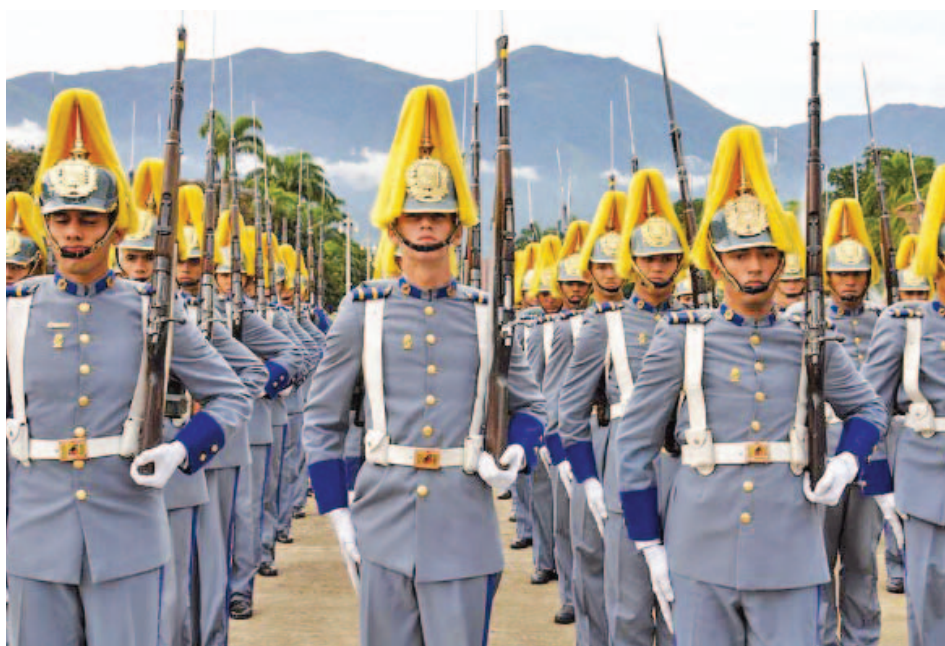
Academia Militar de Venezuela.

Nació en Sabaneta, Barinas, el 28 de julio de 1954. Cursó sus estudios primarios y secundarios en su ciudad natal y prosiguió su formación superior en la Academia Militar de Venezuela, de donde se graduó con el grado de Subteniente en el año 1975. Es licenciado en Ciencias y Artes Militares, rama Ingeniería, mención Terrestre. Ocupó diferentes comandancias en las Fuerzas Armadas Nacionales. Es fundador del Movimiento Bolivariano Revolucionario, surgido en 1982. Tomó parte en la operación militar Ezequiel Zamora en 1992, permaneciendo luego prisionero en la cárcel de Yare entre 1992 y 1994. Una vez liberado, fundó el Movimiento V República. Se presentó como candidato presidencial por esta agrupación política para las elecciones de diciembre de 1998.