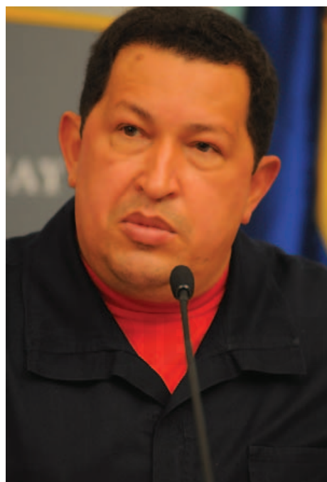
Hugo Chávez Frías.

Columbia, Estados Unidos. Escribió célebres ensayos político-literarios, como “La caída del liberalismo amarillo” (1972) y “Confidencias imaginarias de Juan Vicente Gómez” (1979). También es autor de los estudios históricos “El Táchira y su proceso evolutivo”; “Apuntes para la historia cultural de Venezuela”; “Caudillos y masas en Bolivia”; “El proceso político venezolano del siglo XIX”; “Coro, raíz de Venezuela”; “Manuel María Montañez, el prisionero imaginario”; “La obra histórica de Caracciolo Parra Pérez”; “Venezuela y la Primera Guerra Mundial”; “Pocaterra, actor y testigo de una época”; “Aspectos de la evolución política de Venezuela en el siglo XX”; “Rómulo Betancourt en la historia de Venezuela”; “Los héroes y la historia”; “Individuos de número”.