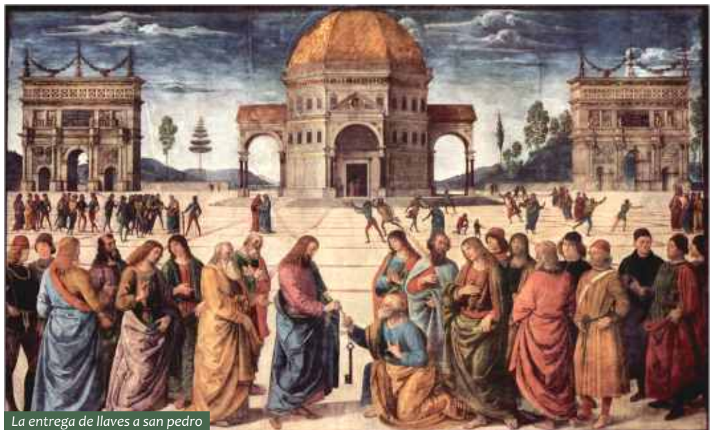
La entrega de llaves a san pedro

Los últimos momentos de su vida los transcurrió trabajando activamente, realizando importantes encargos procedentes de las iglesias de Umbría y Toscana, así como en el año 1505 se empleó en la ejecución de su obra "la Lucha entre el Amor y la Castidad" a pedido de Isabel de Gonzaga. Unos años más tarde se consagró a la decoración de la bóveda de la estancia del Incendio del Borgo en el Vaticano. Finalmente, terminó perdiendo su estilo, al punto tal en que llegó repetir sus producciones más exitosas.