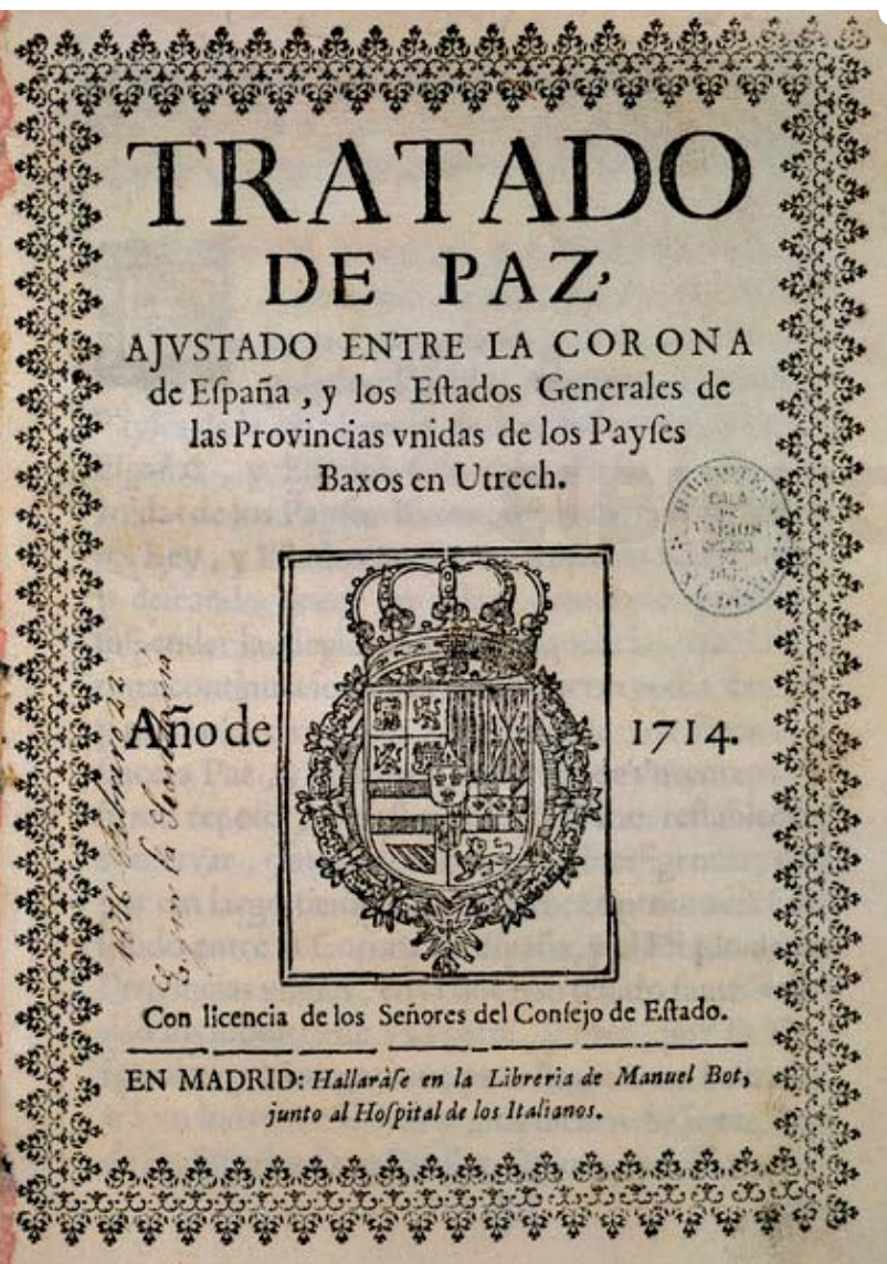
Tratado de Utrecht.

El Capitán Bouganville funda una colonia en las Islas Malvinas; Carlos III de España reclama la soberanía española, que Francia reconoce y por ello tiempo después Bouganville abandona las islas luego de ser indemnizado por sus gastos.