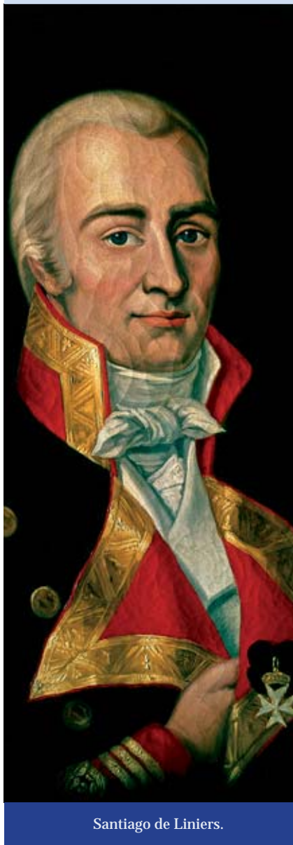
Santiago de Liniers.

Santiago de Liniers (1753 – 1810) fue un militar francés que se desempeñó como administrador colonial de la corona española y virrey del Virreinato del Río de la Plata entre 1807 y 1809.