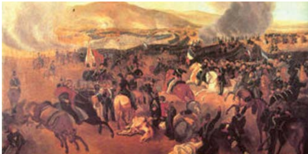
Batalla de Vilcapugio.

En esa fecha el general español Pezuela, excelente militar, sorprendió a las tropas acampadas de Belgrano, pese a los cual éste y Díaz Vélez contraatacaron con éxito. Casi podrían considerarse victoriosos cuando un toque de clarín que surgió de algún lugar desconcertó a las tropas patriotas, sembrando la confusión. Belgrano consiguió, con todo, reagrupar 400 hombres (tenía 3.500 frente a 4.000 de Pezuela). Perdió 300 hombres; los realistas muchos más, aunque tomaron los cañones, el parque y 400 fusiles a los patriotas.