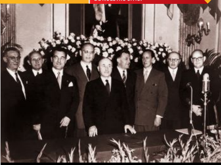
Miembros de la CECA.