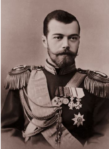
Zar Nicolás II.