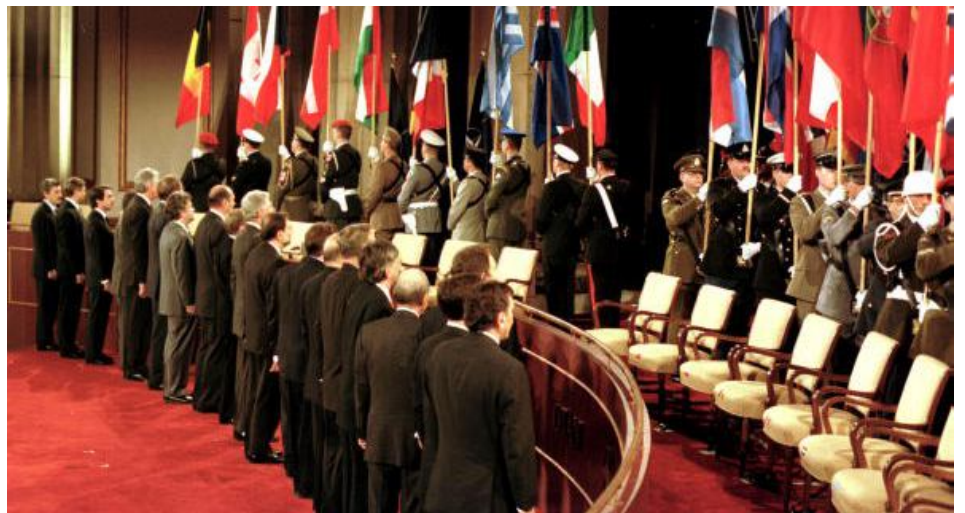
Reunión de la OTAN.

Quienes más se vieron beneficiados fueron Gran Bretaña, Francia, Italia y Alemania Occidental.