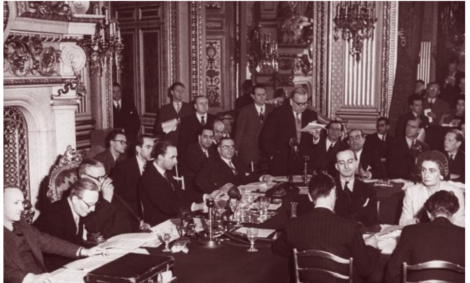
Sexta conferencia de las naciones del Plan Marshall.

Para llevar a cabo esta acción restauradora se pidió a la Unión Soviética y a los países satélites que se sumen al plan para poder alcanzar el objetivo. Pero, nadie le respondió afirmativamente. El plan igual se puso en marcha y en pocos años se vieron reflejados los progresos. Por ejemplo, se duplicó la producción industrial.