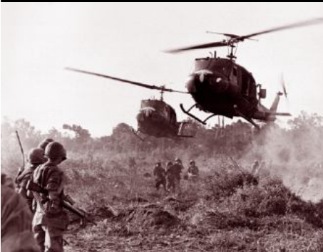
Guerra de Vietnam.

Tan solo algunos países se mantuvieron neutrales a la situación. A partir de esta diferencia ideológica se desarrollaron diferentes luchas económicas y diplomáticas que en muchos casos condujeron a conflictos bélicos. Ejemplo de ellos son la Guerra de Corea y la Guerra de Vietnam.