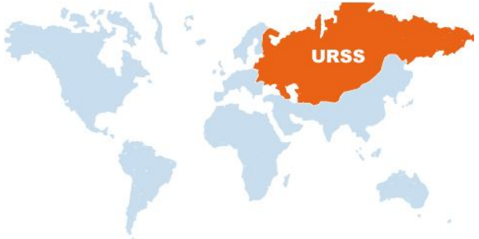
Ubicación de la URSS.

Ese mismo año, Estados Unidos y Rusia inician sus enfrentamientos, cuando los revolucionarios toman el poder comandados por Lenin. De esta manera establecen el primer estado socialista.