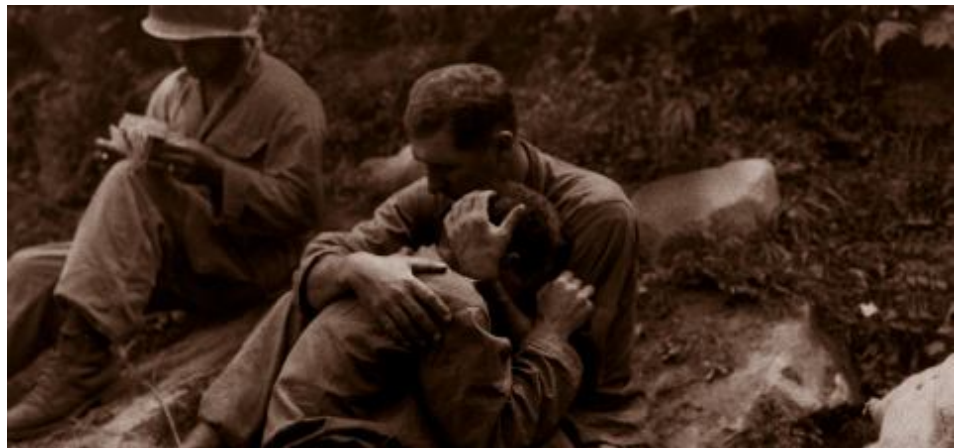
Guerra de Corea.