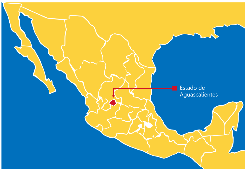
Localización del Estado

El estado de Aguascalientes se encuentra ubicado en el centro de México. Concretamente entre Zacatecas y Jalisco. Se extiende a lo largo de 5.589 kilómetros cuadrados. Ocupa la región occidental de la Altiplanicie Mexicana. Limita al norte con los municipios de Asientos y Pabellón Arteaga, al sur y oriente con el estado de Jalisco y al poniente con Jesús María y Calvillo. Se separa de la Ciudad de México por una distancia de 480 km.