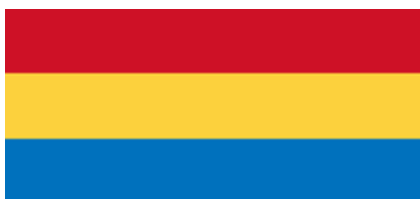
Bandera Propuesta para aguas calientes. No oficial.