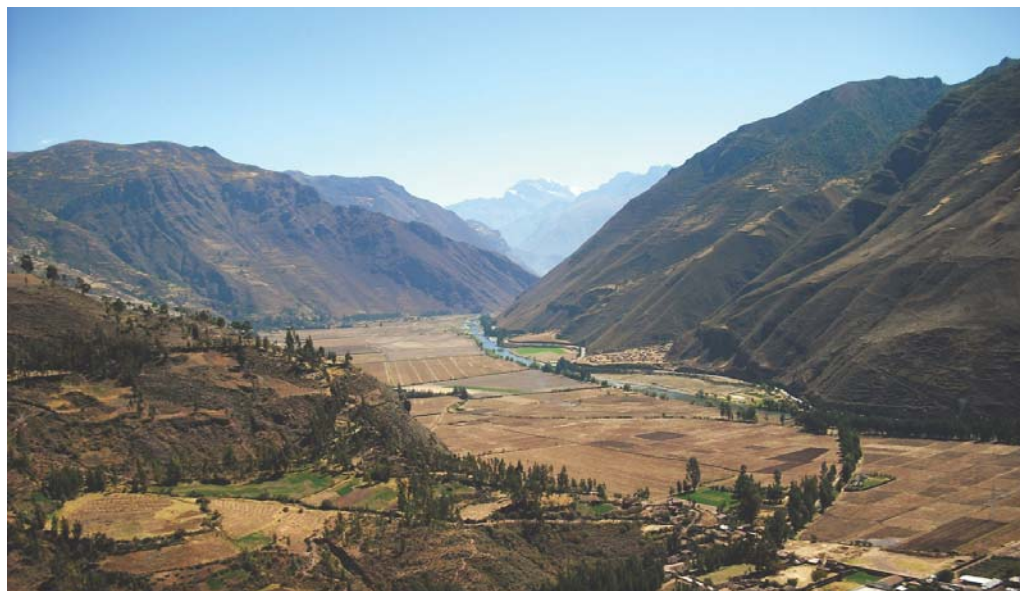
Uno de los múltiples paisajes del Perú, el Valle Sagrado de los Incas

La capital del Perú es la ciudad de Lima, fundada el 18 de enero de 1535 por el conquistador Francisco Pizarro. Está ubicada sobre las márgenes del río Rímac y a orillas del Pacífico. Fue llamada la "Ciudad de los Reyes" y es en la actualidad una urbe donde conviven el esplendor de su pasado con los grandes avances de este siglo, constituyéndose Lima en la sede del gobierno y de las instituciones más importantes del Perú. Desde Lima se tiene contacto con toda la extensión del Perú, un país donde conviven mitos y tradiciones a través de los tiempos, con imponentes paisajes y con restos arqueológicos de las culturas originarias, que hacen del Perú un país de gran diversidad geográfica, social y cultural.