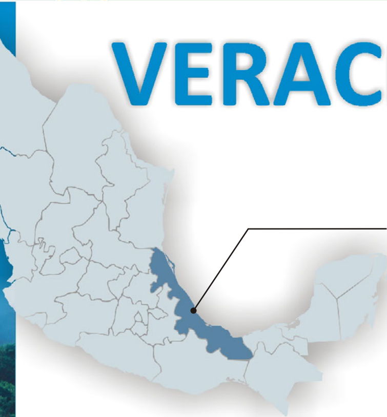
Provincia de Veracruz

Veracruz de Ignacio de la Llave es un estado situado al este de la República Mexicana. Se encuentra ubicado aproximadamente 90 kilómetros del estado de Xalapa y a unos 395 kilómetros de la Ciudad de México. Se divide políticamente en 210 municipios. La ciudad es la cabecera del municipio y allí se encuentra el puerto más importante de México.