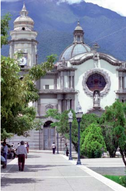
Catedral de Mérida.