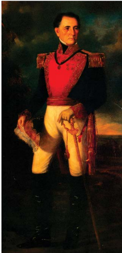
José Tadeo Monagas General del Ejército Republicano, en los tiempos de las guerras independentistas de Venezuela y Presidente del país en dos períodos (1847 - 1851 y 1855 - 1858).

Según el último censo poblacional, realizado en 2007, el Estado de Monagas posee 855,322 habitantes. De ese total, el 50,36 % son hombres, mientras que el resto de los pobladores del distrito son mujeres. Como sucede en todo el país, el idioma hablado es el castellano, oficial del Estado de Monagas y de la República Bolivariana de Venezuela.