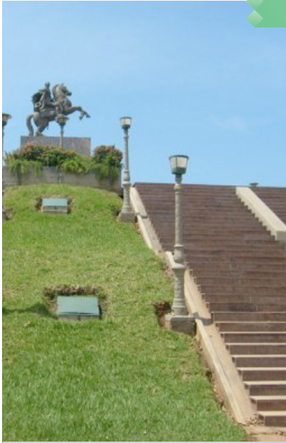
Plaza Bolívar de Maiquetía, Vargas. Derecha: Bandera del estado de Vargas.

El turismo y los servicios son las actividades que dan mayor impulso al desarrollo económico del Estado. Está comunicado con el Distrito Capital por medio de la Autopista Caracas-La Guaira, con el Estado Aragua por la carretera El Junquito-Colonia Tovar y con el Estado Miranda por la vía de montaña Galipán-Ávila y la carretera Chuspa-Higuerote. El aeropuerto internacional más importante del país está ubicado en su territorio (Maiquetía) y el de La Guayra es el segundo puerto de mayor importancia en el país.