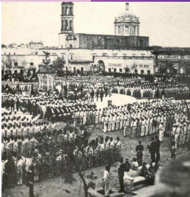
Histórica Plaza de Armas 1878 Durango.

La capital del Estado es Victoria de Durango, que también es conocida como Ciudad de Durango. Fue fundada el 8 de julio de 1563, en una misa oficiada por Fray Diego de la Cadena y celebrada, como así lo refiere la tradición local, en la esquina sureste, donde actualmente se encuentran las calles de 5 de Febrero y Juárez. A la ceremonia asistieron Francisco Ibarra, sus capitanes y vecinos. Más tarde, tuvo lugar el acto de fundación. Desde ese día, la Villa se llamó “Durango”, en recuerdo de la patria chica de