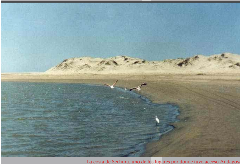
La costa de Sechura, uno de los lugares por donde tuvo acceso Andagoya

Los conquistadores españoles fueron unos de los responsables principales en el nombre de Perú