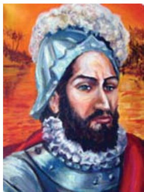
Pascual de Andagoya