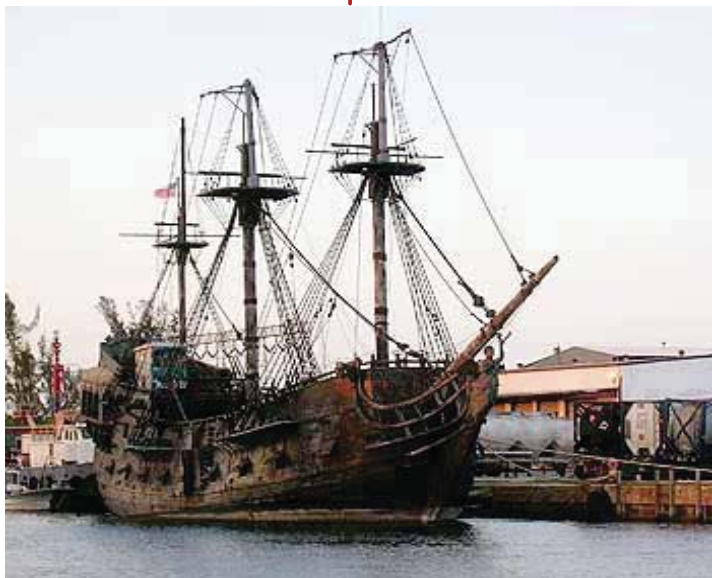
Representación actual de una de las embarcaciones utilizadas en la época

Curiosamente, el nombre de "Perú" no es usado en los documentos oficiales hasta que la corriente popular se impone. Como Birú estaba muy cerca, a solo cincuenta leguas de Panamá, los funcionarios españoles creían que llamar Perú a este otro territorio, la tierra de los incas, iba a llevar a confusiones. Pizarro y Almagro durante la conquista habían llamado al nuevo territorio "El Levante", y no les parece conveniente usar el nombre de "Perú" por este mismo motivo.