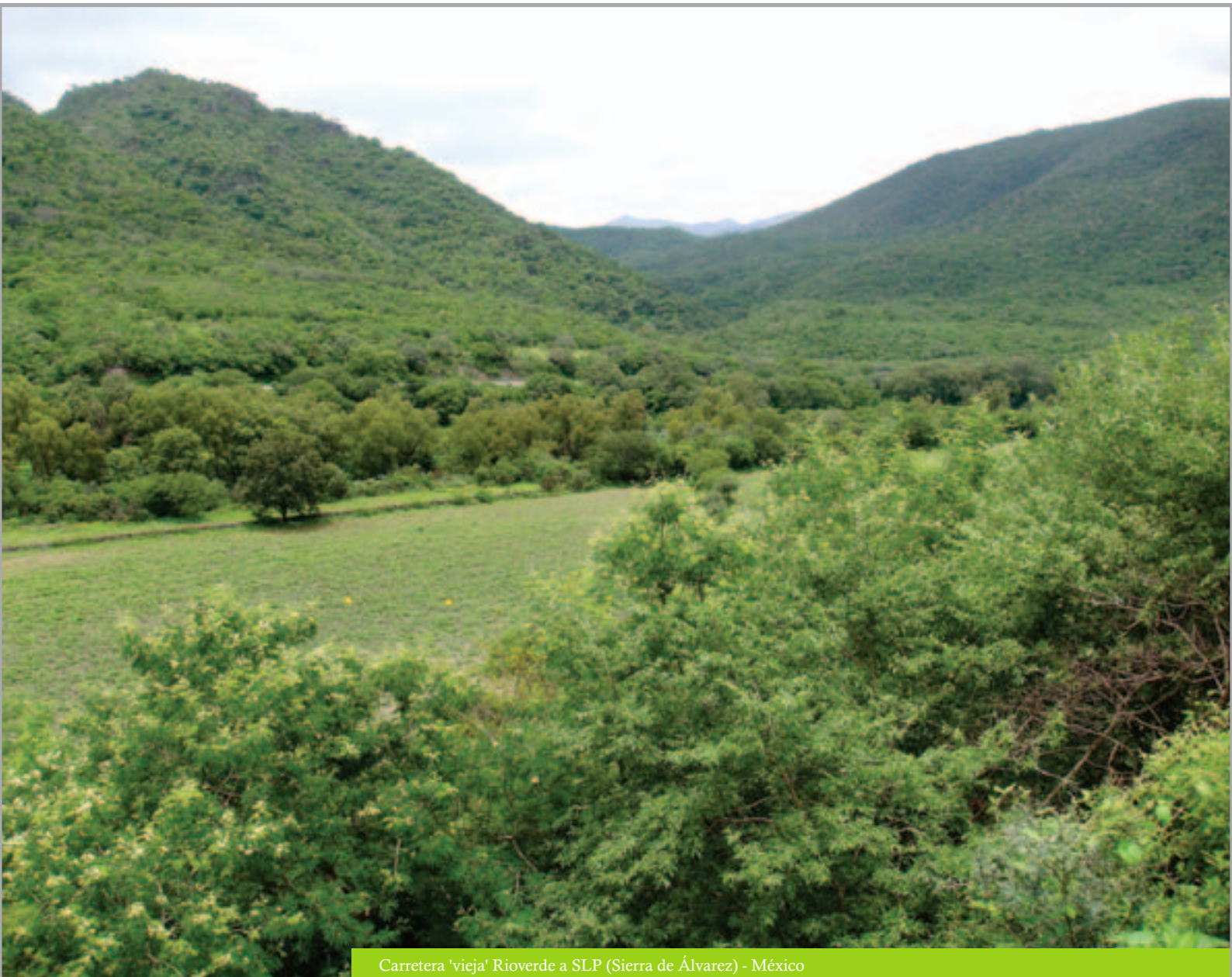
Carretera 'vieja' Rioverde a SLP (Sierra de Álvarez) - México

Este sistema corre de sur a norte y hacia el oriente apoyándose al sur en las derivaciones de la Sierra Gorda, continuando por la Sierra de Álvarez el Cerro de San Pedro, Tanque de Luna, Sierra de la Tinaja, los cerros de Arista y El Epazote hasta topar con la Sierra de Catorce. Luego continúa hacia el norte por la sierra de El Sotol hasta los límites del estado, recorre los municipios de Santa María del Río, San Luis Potosí, Zaragoza, Cerro de San Pedro, Armadillo, San Nicolás Tolentino, Villa Hidalgo, Cerritos y Guadalcázar. El río San Nicolás, uno de los afluentes principales del Río Verde se encarga de drenar el sistema. De este es que se desprenden otros sistemas, como el que se desplaza del pie de la Sierra de Catorce, por el lado oriente hacia el sur, con los nombres de Sierra de Pastoriza, Solís, El Gorrión y El Lebrillo hasta terminar en los cerros de Charco Blanco en donde limita el valle de Peotillos. La Sierra de las Pilas también se deriva de aquí. La Sierra de Catorce es la que cuenta con los picos más altos de San Luis Potosí, que sobrepasan los 3.000 metros sobre el nivel del mar.