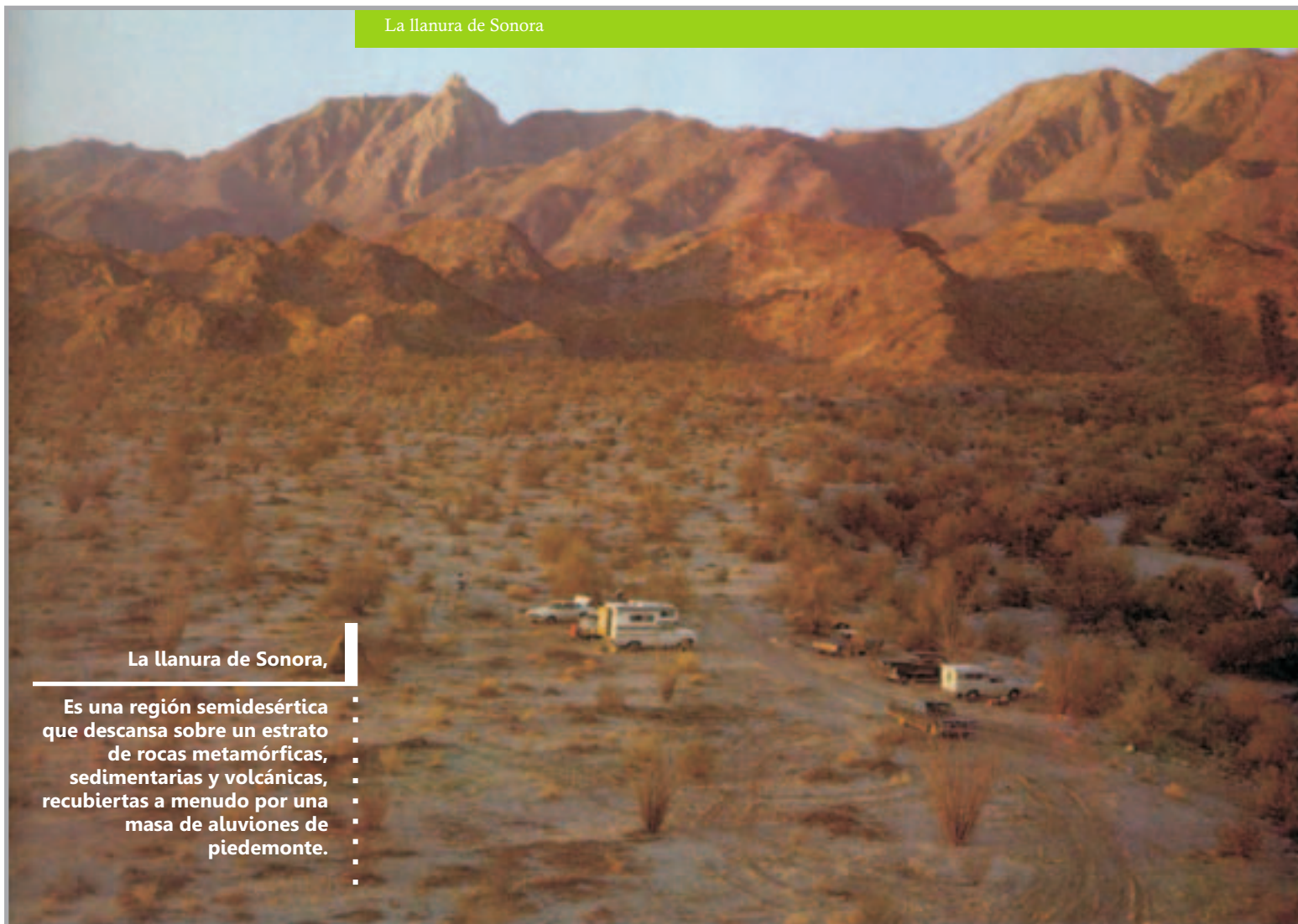
La llanura de Sonora

Zacatecas. Los sistemas orográficos del Altiplano forman una provincia fisiográfica junto con sus propias colindancias con la región Media, a partir de su origen geológico y su estructura predominante. Estos representan el grupo orográfico más importante del estado después de la Sierra Madre Oriental y tienen como base, en el sur, las estructuras ígneas derivadas del sistema llamado Sierra Gorda. Allí se destacan las serranías de Santa María del Río, Zaragoza y las del sur, sureste y suroeste de la cuenca del Río Verde.