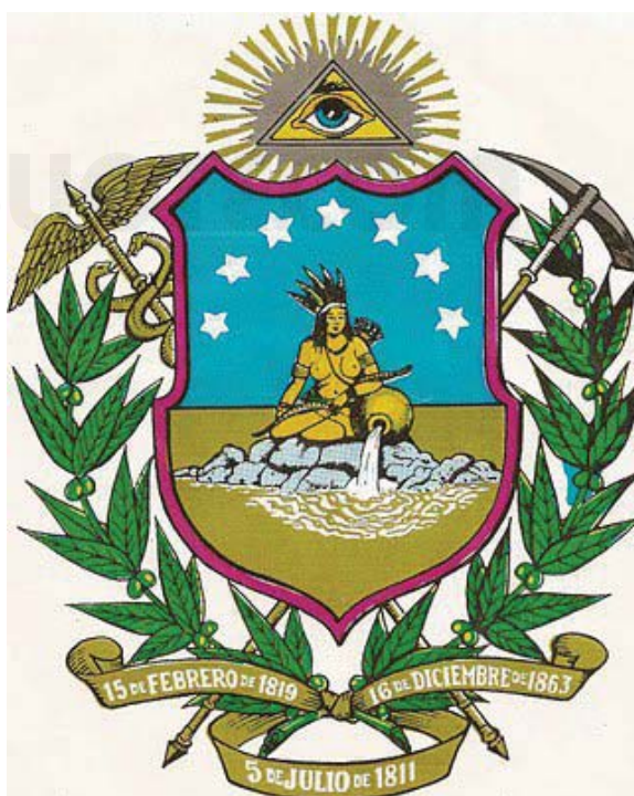
Arriba: Fragmentos del escudo del estado de Bolívar.

Además, el escudo posee una rama de olivo, como símbolo de la gloria y el triunfo, además de un caduceo, el cual representa a la sabiduría y la salud. En tanto, acorde a la realidad de una parte importante de la clase trabajadora del estado de Bolívar, la insignia lleva también un pico como los que se utilizan para las actividades mineras, y un retazo de tela dorado, representando la riqueza de las tierras bolivarianas y que posee tres fechas: