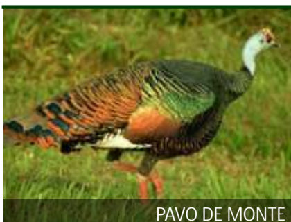
PAVO DE MONTE

PIIJE: Es otro tipo de pato grande, con el pico y las patas de color rosa, que ocasionalmente son muy intensos. La cabeza y el cuello, en tanto, son una tonalidad gris. Se lo conoce como pato silbador por el sonido que emiten semejante a un silbido.