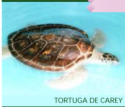
TORTUGA DE CAREY

TORTUGA DE CAREY: La ya mencionada tortuga marina puede llegar a alcanzar un metro de largo. Anida en todas las playas del Estado, desde Celestún hasta El Cuyo. Es en su caparazón que puede verse una de sus principales características: la de tener placas que se sobreponen unas sobre otras y que están hechas del carey que le dan nombre; por lo que tienen una belleza singular.