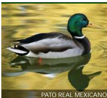
PATO REAL MEXICANO

MATRACA: Es el nombre con el que se identifica a un pequeño pájaro de color café jaspeado que suele escopnderse en los matorrales de las dunas costeras. Se trata de una especie endémica dentro de toda la Península de Yucatán. Una particularidad que tienen es que es común escuchar al macho y a la hembra cantar al mismo tiempo para defender su territorio.