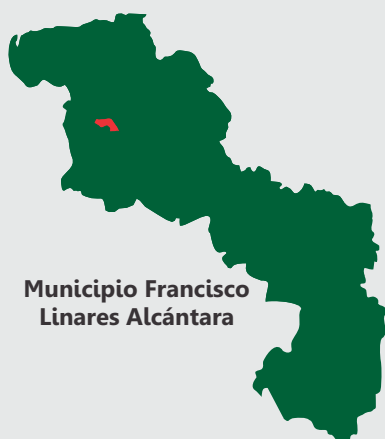
Municipio Francisco Linares Alcántara

Para llegar a consolidarse, el 16 de diciembre de 1997, como municipio Francisco Linares Alcántara, el mismo tuvo que atravesar varios procesos. En primer lugar, pasó por diferentes cambios de propietarios a lo largo de la historia. Entre ellos estuvieron, primero, Joaquín Crespo y, unos años después, Juan Vicente Gómez. Luego, por orden del gobierno, las tierras del municipio fueron cedidas a la población, tras la fundación de varios barrios en la zona, conformando así una parroquia dentro del municipio Santiago Mariño.