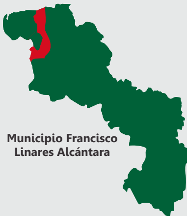
Municipio Francisco Linares Alcántara