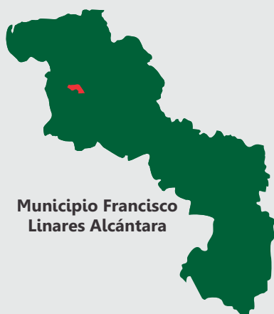
Municipio Francisco Linares Alcántara

Para llegar a consolidarse, el 16 de diciembre de 1997, como municipio Francisco Linares Alcántara, el mismo tuvo que atravesar varios procesos. En primer lugar, pasó por diferentes cambios de propietarios a lo largo de la historia. Entre ellos estuvieron, primero, Joaquín Crespo y, unos años después, Juan Vicente Gómez. Luego, por orden del gobierno, las tierras del municipio fueron cedidas a la población, tras la fundación de varios barrios en la zona, conformando así una parroquia dentro del municipio Santiago Mariño.