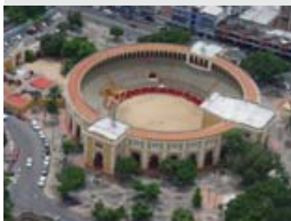
Arriba: Teatro Ateneo. Abajo: Maestranza César Girón.

Por último, resulta importante señalar que el municipio de Giradot cuenta con muchos sitios turísticos y de interés general. Ya sea por sus paisajes naturales o por su arquitectura que combina lo moderno con lo colonial, este municipio siempre tiene algo que ofrecer a quien lo visita. La ciudad de Maracay cuenta con los Museos de Antropología e Historia y con el Museo Aeronáutico, el Parque Zoológico Las Delicias y el Complejo Cívico Simón Bolívar. Además, hay variadas y bonitas plazas que adornan la urbe y obras de la arquitectura que resultan icónicas en la ciudad como son el Teatro Ateneo de Maracay y la Maestranza César Girón, por ejemplo.