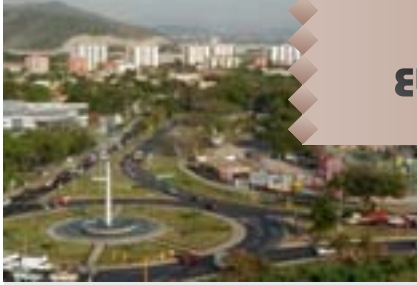
Arriba: Obelisco de Maracay. Derecha: Vista de la ciudad de Maracay.

El municipio de Giradot no sólo es reconocido por su capital, la ciudad de Maracay, bautizada como Ciudad Jardín; sino también por ser un destino turístico y un centro de acrecentamiento económico, además de haber visto nacer a grandes personalidades venezolanas.