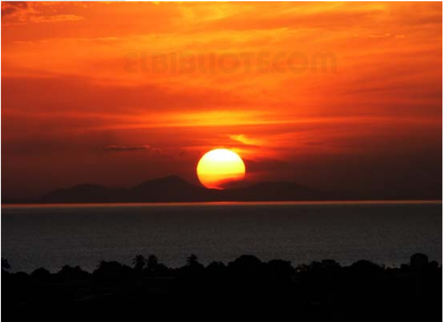
Atardecer en el lago Los Ticaragua.

El municipio de Francisco Linares Alcántara cuenta con variados lugares de interés general. Es así que podemos mencionar la plaza Bolívar de Santa Rita, la plaza de Francisco de Miranda, el Lago de Tacarigua, la Casona de Santa Rita, lugar en donde funciona actualmente el Despacho de la Alcaldía, el Museo de CANTV, además de distintas iglesias. Así también, este municipio alberga al núcleo La Morita de la Universidad de Carabobo. Esta última es una casa superior de estudios reconocida por su excelencia además de sus variadas ofertas académicas.