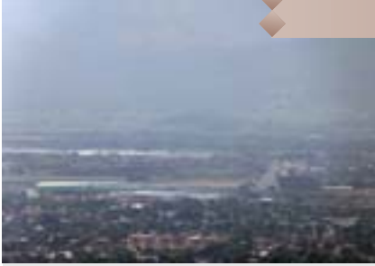
Vista de Los Aviadores desde las alturas.

el estado, limitando por el este y por el norte con el municipio Santiago Mariño, hacia el sur con los municipios del Libertador y José Ángel Lamas y, finalmente, limita al oeste con el municipio de Giradot. De esta manera, queda en evidencia la ubicación estratégica de la que goza el municipio. Así también, el municipio de Francisco Linares Alcántara cuenta con acceso sencillo a la autopista regional del centro. Esta arteria vial es de suma relevancia para el estado, encontrándose próxima de la redoma de El Avión, el cuál integra parte de uno de los íconos de la entidad. Así también, este municipio posee la autopista de Los Aviadores que lo une con la localidad de Maracay y con el Libertador. Aquí resulta relevante hacer referencia a la construcción del centro comercial más grande de Aragua, que se construye sobre esta avenida y se prevé que será el más grande de Venezuela.