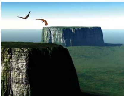
Chimantá - Tepuy. Derecha: monte Auyantepuy

Más hacia el sur, se encuentra el Chimantá-Tepuy y el Acopán-Tepuy, dos de los cerros más altos de la región, además de la Gran Sabana, de una altura mucho menor pero que sin embargo, es fácilmente reconocible en el paisaje. En tanto, hacia el noreste de la región oriental de Bolívar se encuentran algunas elevaciones más jóvenes, como la Imataca y la Nuria, con 790 y 760 metros respectivamente.