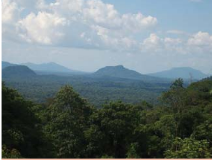
Monte Imataca. Derecha: Río Canaima.

-Región Occidental: es la que se ubica entre las aguas del Caura y las sierras de Maigualida. En esta región se ubica el cerro Guanay, el cual constituye la principal elevación, superando los 2.300 metros sobre el nivel del mar.