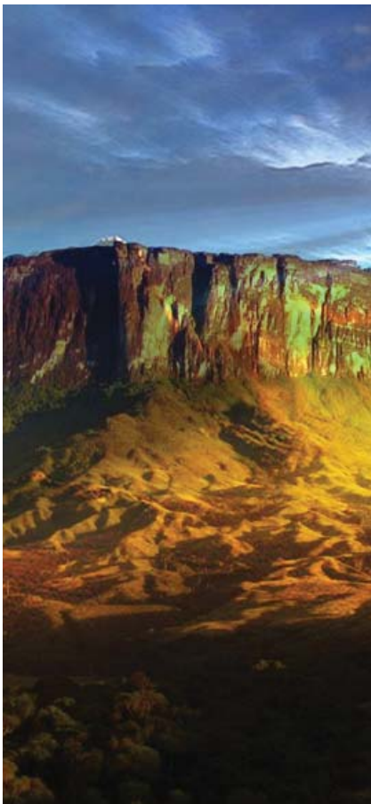
Roraima, vista panorámica.