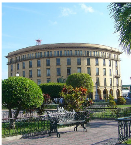
Tampico - Tamaulipas

Las diversas masas de agua que pueden encontrarse en la zona hacen que sea ideal para la pesca deportiva, una actividad que los turistas pueden realizar indistintamente, tanto en la captura de especies de agua dulce como salada. La variedad natural que se encuentra en Tampico se ve reflejada en una gastronomía especializada fundamentalmente en especies marinas, por lo que no es extraño encontrarse con suculentos platillos de frescos pescados y mariscos.