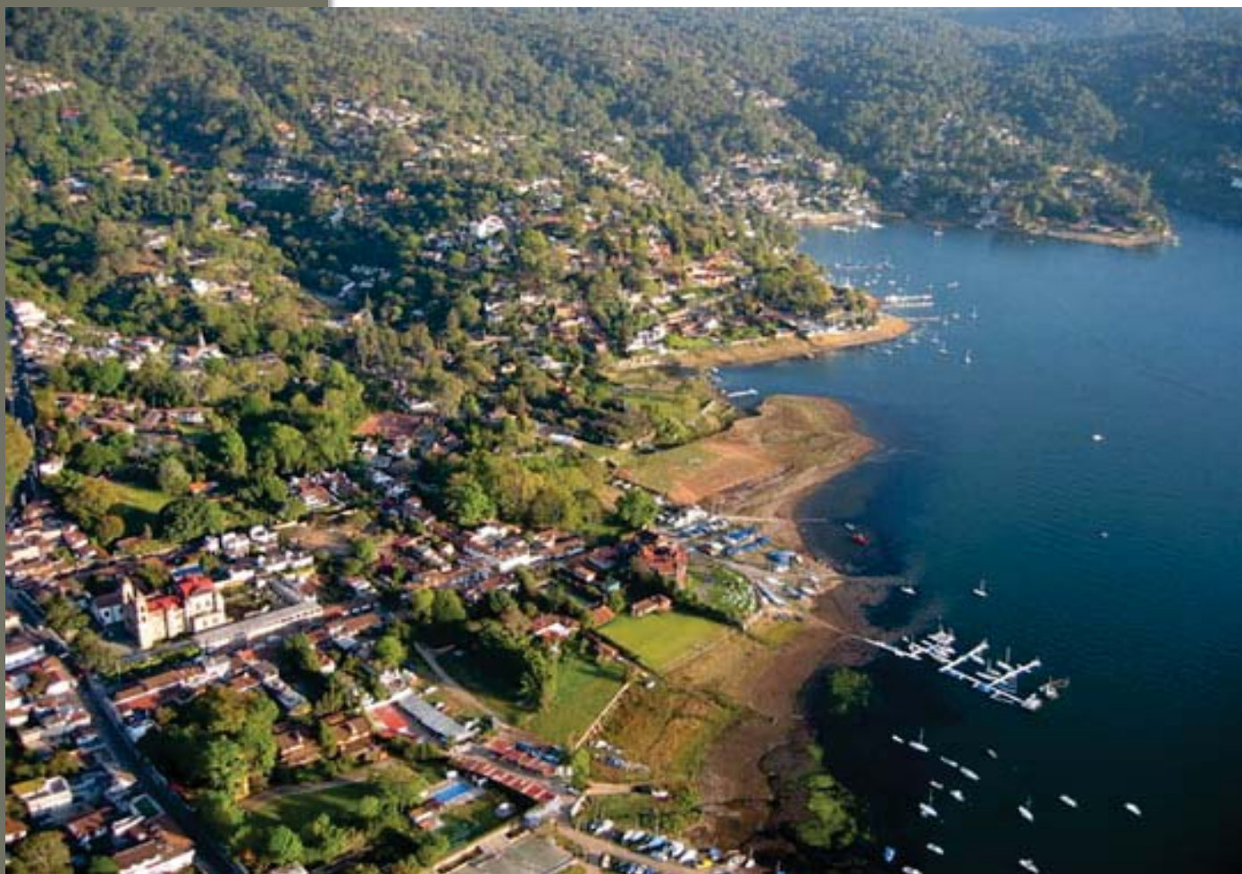
Vista aérea de Valle de Bravo

Las principales actividades económicas que pueden encontrarse son la producción de loza de barro vidriado, alfarería y otras artesanías; así como de una naciente industria de hortalizas y conservas orgánicas de excelente calidad. Se calcula que en la actualidad hay un total 57 mil habitantes, integrada en 44 comunidades, muchas de las cuales son de origen aborigen.